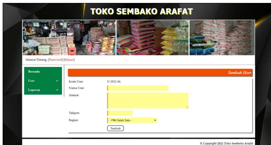
Gambar 5.17 Tambah User

Halaman tambah user merupakan halaman yang terdapat field yang digunakan untuk menambah data user dengan mengisi nama user, alamat, telepon, dan bagian. Gambar 5.17 tambah user merupakan hasil implementasi dari rancangan pada gambar 4.46.