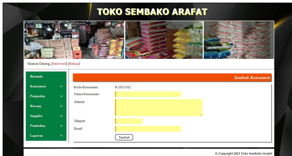
Gambar 5.9 Tambah Konsumen

Halaman tambah konsumen merupakan halaman yang terdapat field yang digunakan untuk menambah data konsumen dengan mengisi nama konsumen, alamat, telepon dan email. Gambar 5.9 tambah konsumen merupakan hasil implementasi dari rancangan pada gambar 4.38.