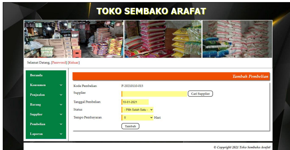
Gambar 5.13 Tambah Pembelian