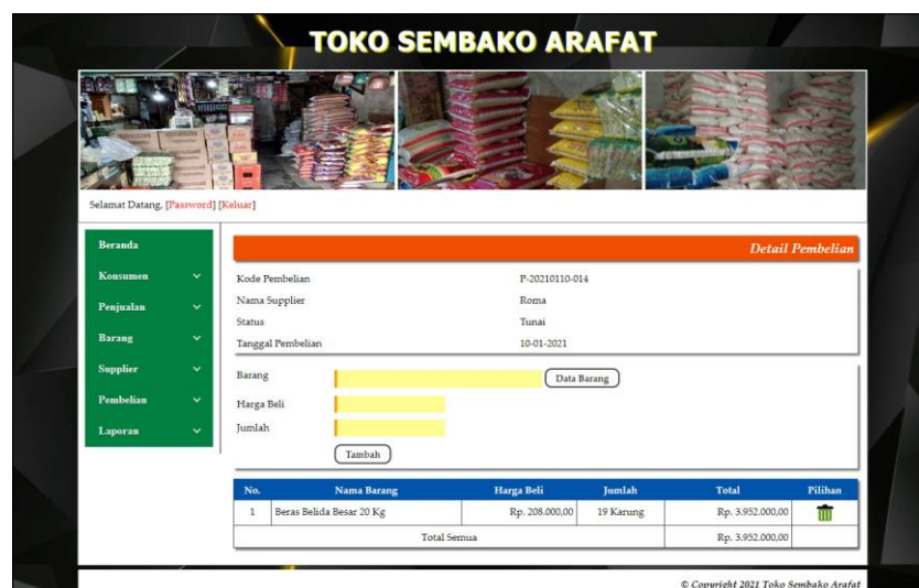
Gambar 5.14 Detail Pembelian

Halaman detail pembelian merupakan halaman yang terdapat field yang digunakan untuk menambah data detail pembelian dengan mengisi barang, harga beli dan jumlah serta terdapat tabel informasi mengenai tabel detail pembelian. Gambar 5.14 detail pembelian merupakan hasil implementasi dari rancangan pada gambar 4.43.