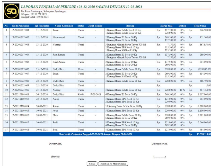
Gambar 5.7 Laporan Penjualan