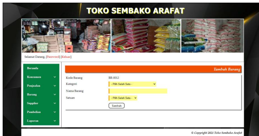
Gambar 5.12 Tambah Barang

Halaman tambah barang merupakan halaman yang terdapat field yang digunakan untuk menambah data barang dengan mengisi kategori, nama barang, dan satuan. Gambar 5.12 tambah barang merupakan hasil implementasi dari rancangan pada gambar 4.41.