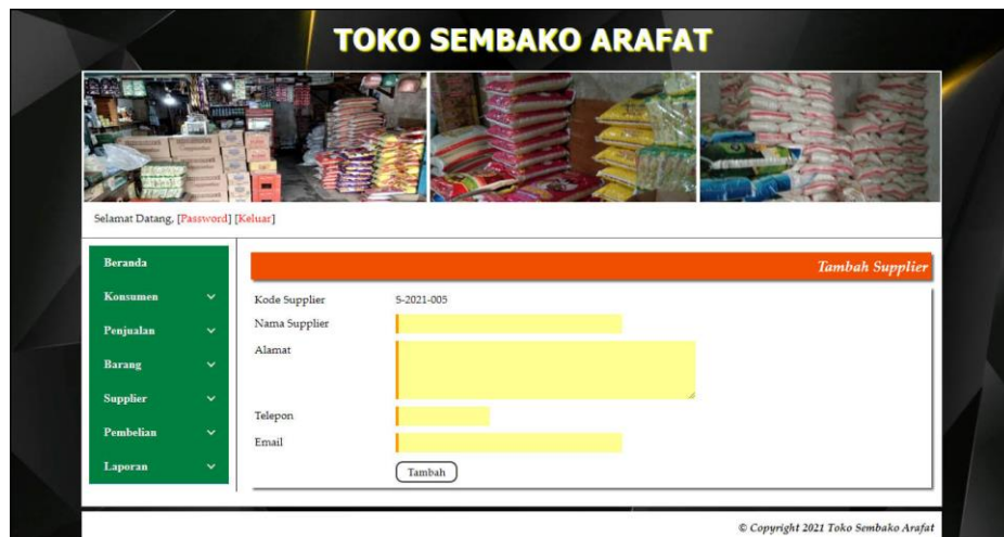
Gambar 5.10 Tambah Supplier