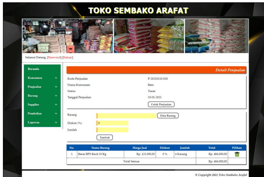
Gambar 5.16 Detail Penjualan