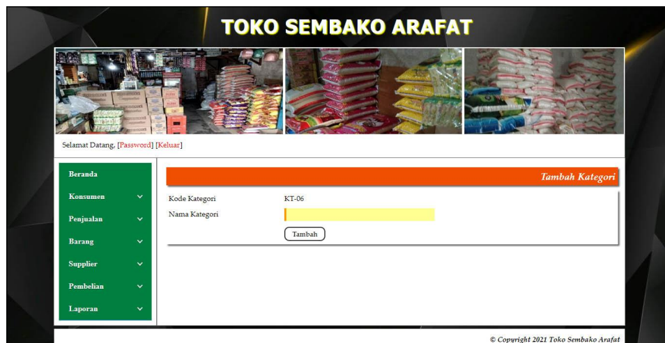
Gambar 5.11 Tambah Kategori

Halaman tambah kategori merupakan halaman yang terdapat field yang digunakan untuk menambah data kategori dengan mengisi nama kategori. Gambar 5.11 tambah kategori merupakan hasil implementasi dari rancangan pada gambar 4.40.