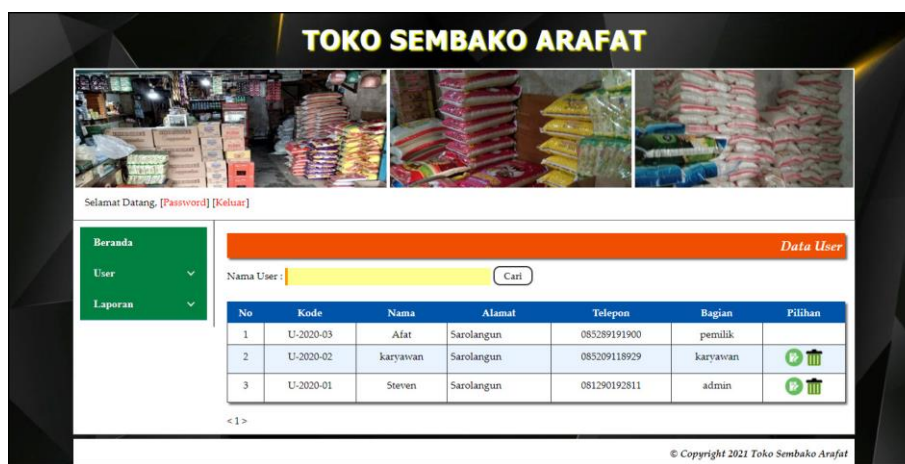
Gambar 5.5 Tabel User

Halaman tabel user merupakan halaman yang menampilkan informasi data user yang terdiri dari no, kode, nama, alamat, telepon, bagian dan pilihan untuk mengubah dan menghapus data user. Gambar 5.5 tabel user merupakan hasil implementasi dari rancangan pada gambar 4.34.