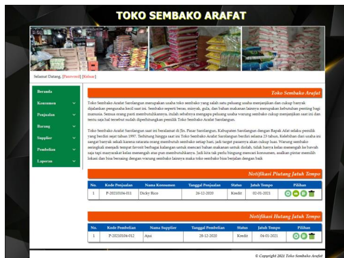
Gambar 5.1 Beranda

Halaman beranda merupakan halaman yang berisikan informasi mengenai Toko Sembako Arafat Sarolangun dan terdapat menu dan link yang menghubungkan ke halaman lainnya. Gambar 5.1 beranda merupakan hasil implementasi dari rancangan pada gambar 4.30.