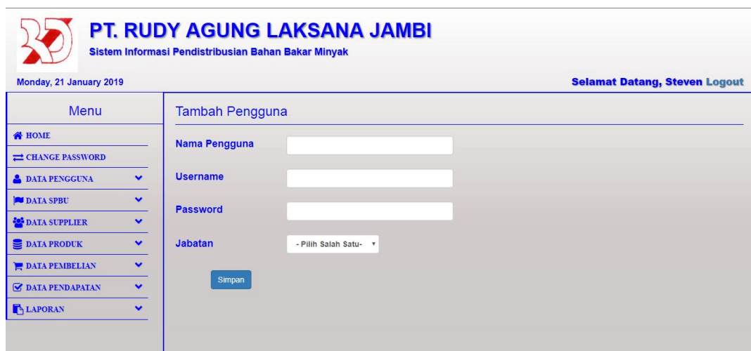
Gambar 5.13 Tampilan Halaman Tambah Pengguna

Halaman tambah pengguna merupakan halaman yang digunakan oleh pengguna sistem untuk menambah data pengguna baru ke dalam sistem. Gambar 5.13 merupakan hasil implementasi dari rancangan pada gambar 4.36.