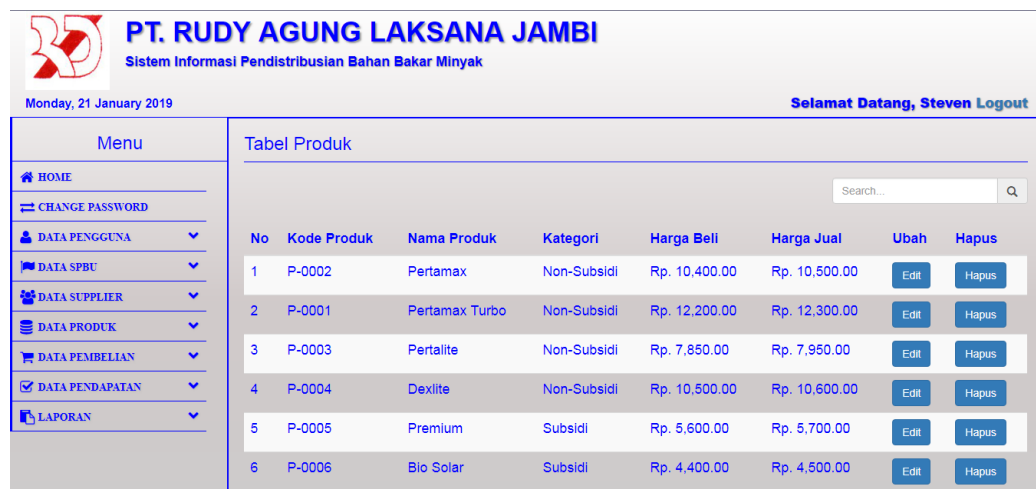
Gambar 5.5 Tampilan Halaman Tabel Produk

Halaman table produk merupakan halaman yang dapat diakses oleh pengguna sistem untuk mengelola data produk serta terdapat link untuk mengubah data produk sesuai dengan kebutuhan. Gambar 5.5 merupakan hasil implementasi dari rancangan pada gambar 4.28.