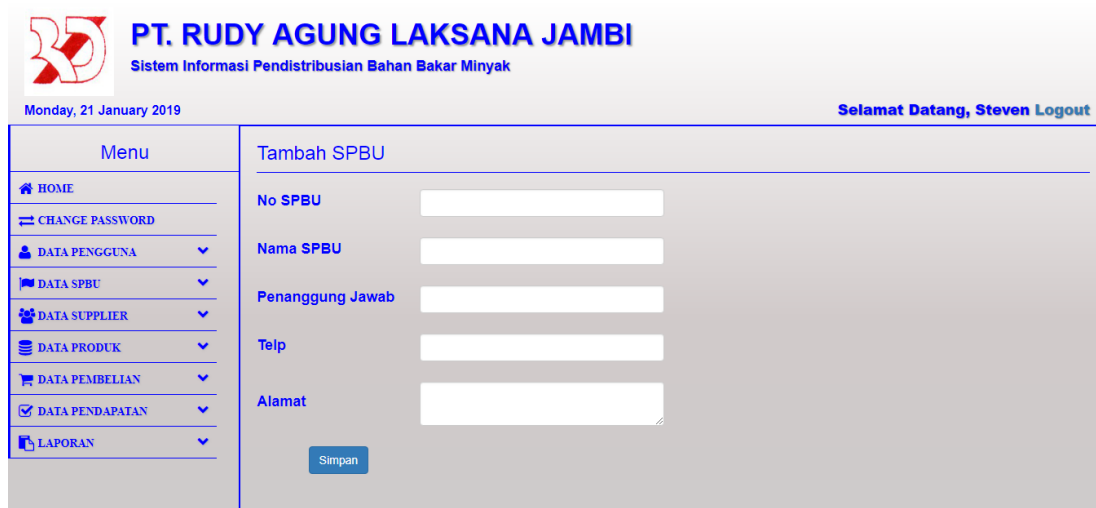
Gambar 5.14 Tampilan Halaman Tambah SPBU

Halaman tambah SPBU merupakan halaman yang digunakan oleh pengguna sistem untuk menambah data SPBU baru ke dalam sistem. Gambar 5.14 merupakan hasil implementasi dari rancangan pada gambar 4.37.