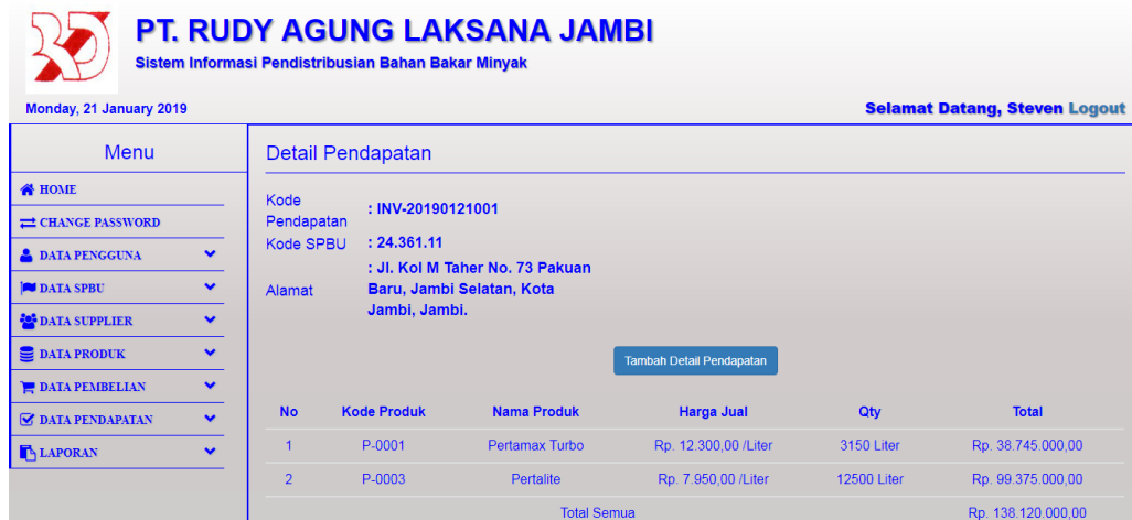
Gambar 5.9 Tampilan Halaman Tabel Detail Pendapatan