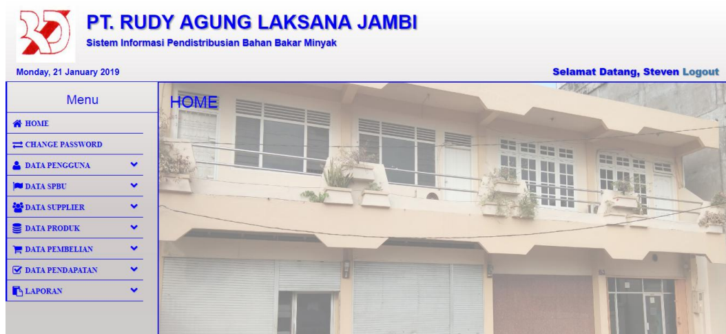
Gambar 5.1 Tampilan Halaman Home

Tampilan halaman home merupakan halaman yang berisikan menu dan link untuk membuka ke halaman lainnya. Gambar 5.1 merupakan hasil implementasi dari rancangan pada gambar 4.24.