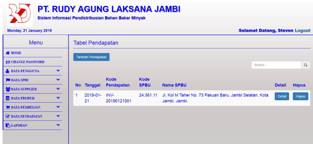
Gambar 5.8 Tampilan Halaman Tabel Pendapatan

Halaman tabel pendapatan merupakan halaman yang dapat diakses oleh pengguna sistem untuk mengelola data pendapatan dengan berisikan data pendapatan terdapat link untuk melihat detail pendapatan dan menghapus data pendapatan sesuai dengan kebutuhan. Gambar 5.8 merupakan hasil implementasi dari rancangan pada gambar 4.31.