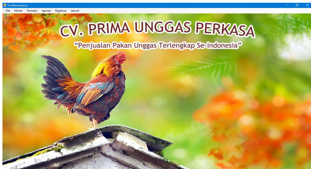
Gambar 5.2 Halaman Menu Utama

Halaman menu utama merupakan tampilan pertama kali saat admin atau sales manager atau direktur telah melakukan proses login dan terdapat menu-menu untuk menuju ke halaman lain Gambar 5.2 merupakan hasil implementasi dari rancangan pada gambar 4.42