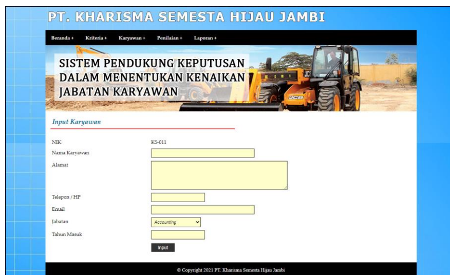
Gambar 5.2 Halaman Input Karyawan

Halaman input karyawan merupakan halaman yang menampilkan form untuk menambah data karyawan baru dengan kolom yang terdiri dari nama karyawan, alamat, telepon / hp, email, jabatan dan tahun masuk. Gambar 5.2 input karyawan merupakan hasil implementasi dari rancangan pada gambar 4.24.