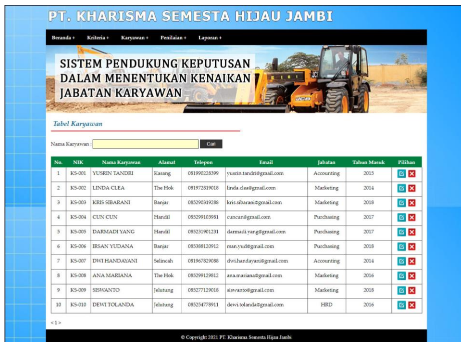
Gambar 5.7 Halaman Tabel Karyawan

Halaman tabel karyawan merupakan halaman yang menampilkan informasi lengkap dari karyawan dan terdapat pengaturan untuk mengubah dan menghapus data. Gambar 5.7 tabel karyawan merupakan hasil implementasi dari rancangan pada gambar 4.29.