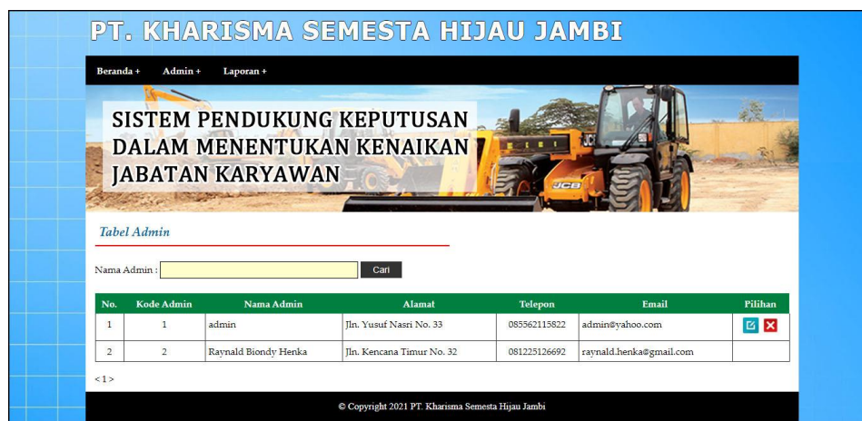
Gambar 5.13 Halaman Tabel Admin

Halaman tabel admin merupakan halaman yang menampilkan informasi lengkap dari admin dan terdapat pengaturan untuk mengubah dan menghapus data. Gambar 5.13 tabel admin merupakan hasil implementasi dari rancangan pada gambar 4.35.