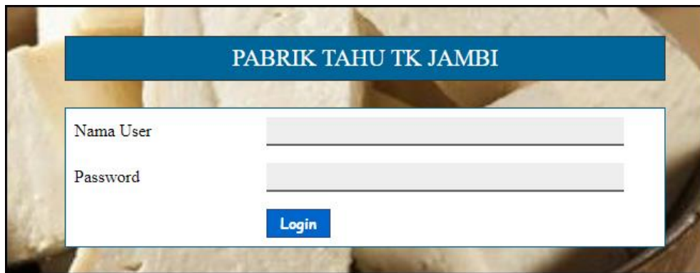
Gambar 5.1 Halaman Form Login