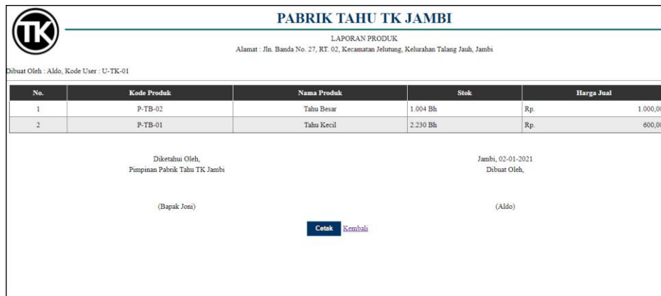
Gambar 5.17 Halaman Laporan Produk