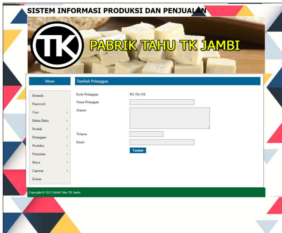
Gambar 5.2 Halaman Tambah Pelanggan

Halaman tambah pelanggan merupakan halaman yang menampilkan form untuk menambah data pelanggan ke dalam sistem dengan menginput nama pelanggan, alamat, telepon dan email. Gambar 5.2 tambah pelanggan merupakan hasil implementasi dari rancangan pada gambar 4.35