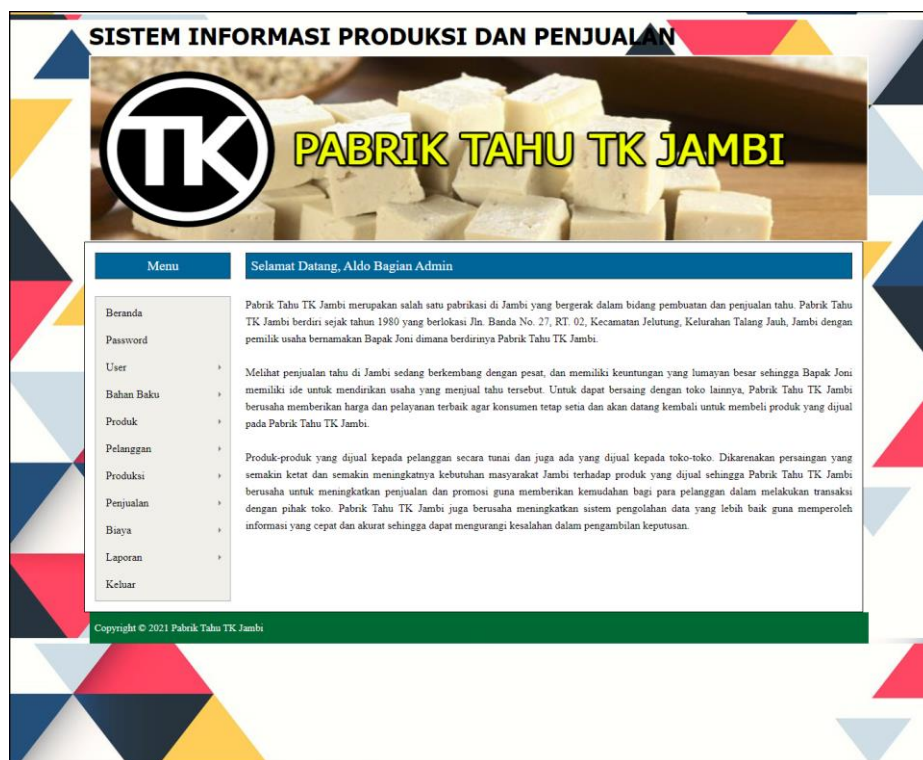
Gambar 5.10 Halaman Beranda

Halaman beranda merupakan tampilan pertama kali saat admin telah melakukan proses login dan terdapat menu-menu untuk menuju ke halaman lain serta berisikan informasi mengenai Pabrik Tahu TK Jambi. Gambar 5.10 merupakan hasil implementasi dari rancangan pada gambar 4.43.