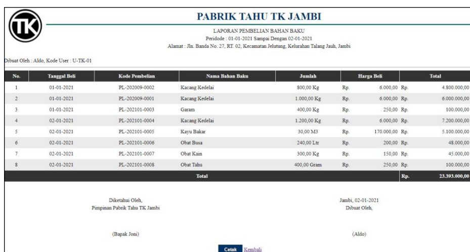
Gambar 5.16 Halaman Laporan Pembelian Bahan Baku

Halaman laporan pembelian bahan baku merupakan halaman yang menampilkan informasi pembelian bahan baku yang telah ditambahkan dengan terdapat no, tanggal beli, kode pembelian, nama bahan baku, jumlah, harga beli dan total. Gambar 5.16 laporan pembelian bahan baku merupakan hasil implementasi dari rancangan pada gambar 4.49.