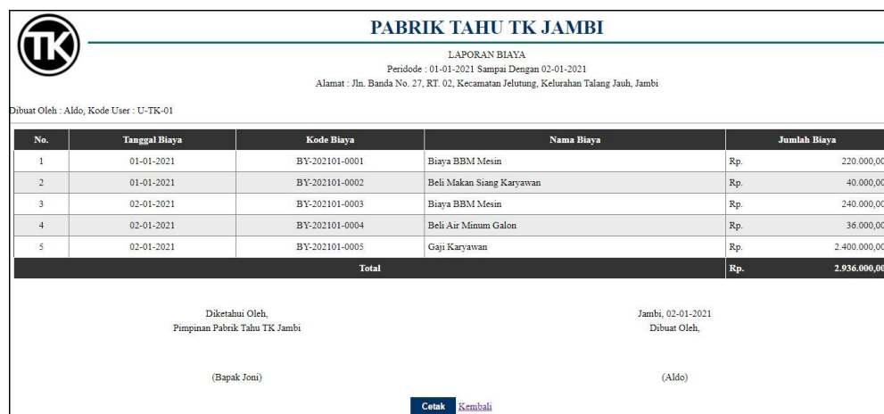
Gambar 5.13 Halaman Laporan Biaya

halaman laporan biaya merupakan halaman yang berisikan informasi mengenai data biaya yang telah diinput dengan menampilkan no, tanggal biaya, kode biaya, nama biaya, dan jumlah biaya. Gambar 5.13 laporan biaya merupakan hasil implementasi dari rancangan pada gambar 4.46.