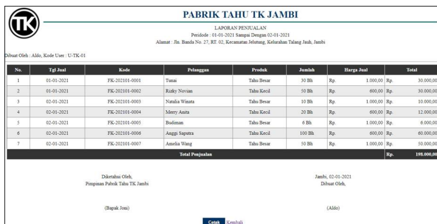
Gambar 5.12 Halaman Laporan Penjualan

halaman laporan penjualan merupakan halaman yang berisikan informasi mengenai data penjualan yang telah diinput dengan menampilkan no, tgl jual, kode, pelanggan, produk, jumlah, harga jual dan total. Gambar 5.12 laporan penjualan merupakan hasil implementasi dari rancangan pada gambar 4.45