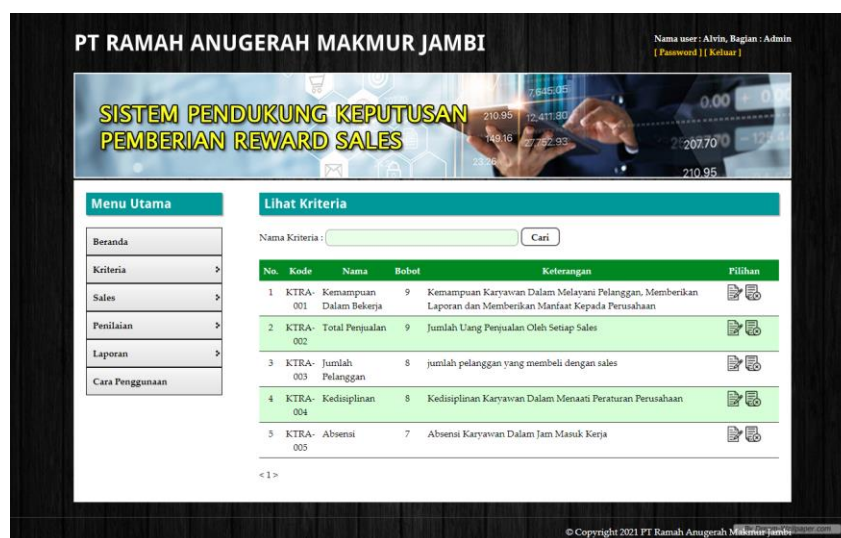
Gambar 5.7 Halaman Lihat Kriteria

Halaman lihat kriteria menampilkan data kriteria yang telah diinput oleh pengguna sistem serta terdapat pilihan untuk mengubah dan menghapus data kriteria pada sistem. Gambar 5.7 lihat kriteria merupakan hasil implementasi dari rancangan pada gambar 4.30, sedangkan listing program ada pada lampiran.