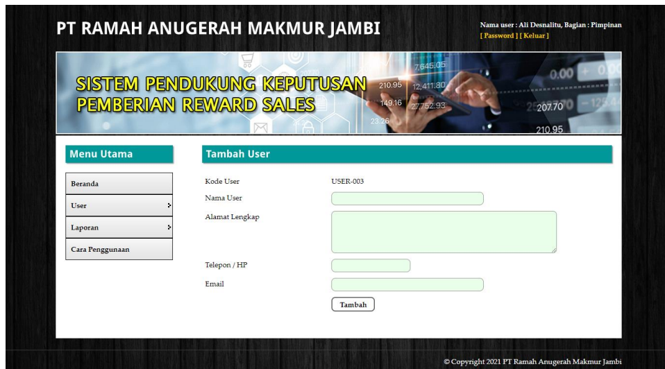
Gambar 5.6 Halaman Tambah User