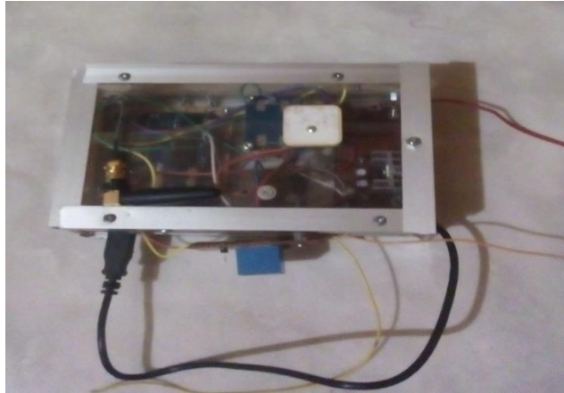
Gambar 5.3 Tampak Bentuk Fisik Alat Pemanfaatan Tas Sekolah