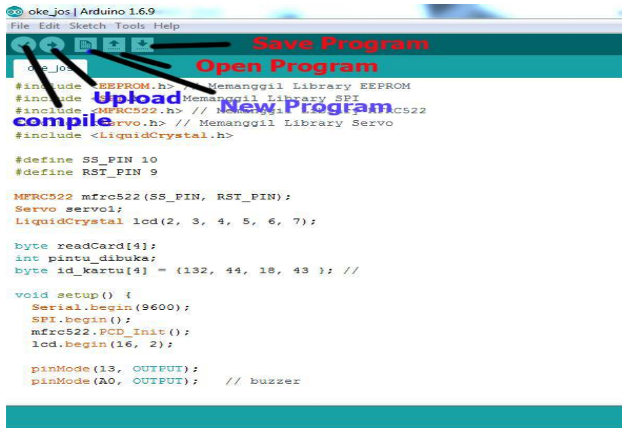
Gambar 5.2 Halaman Save , compile dan Upload Program

Setelah menyelesaikan listing program untuk membaca GPS, SMS GATEWAY, dan save program yang telah dibuat dan kita compile terlebih dahulu jika program tidak ada pesan error maka listing program siap di- upload seperti gambar 5.2 :