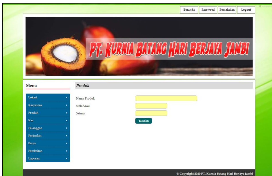
Gambar 5.14 Halaman Tambah Produk

Halaman tambah produk merupakan form yang digunakan untuk menambah data produk yang baru dengan mengisi data nama produk, stok awal dan satuan di kolom yang tersedia pada sistem. Gambar 5.14 merupakan hasil implementasi dari rancangan pada gambar 4.48, sedangkan listing code program PHP ada pada lampiran.