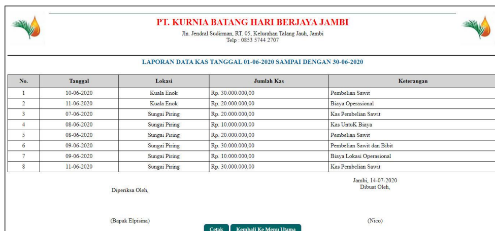
Gambar 5.5 Halaman Laporan Kas

Halaman laporan supir menampilkan informasi mengenai data kas pemindahan dari kantor pusat ke kantor cabang dengan menampilkan tanggal, lokasi, jumlah kas dan keterangan pada sistem dan terdapat tombol untuk mencetak laporan. Gambar 5.5 merupakan hasil implementasi dari rancangan pada gambar 4.39, sedangkan listing code program PHP ada pada lampiran.