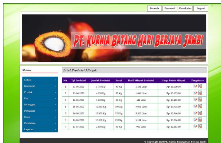
Gambar 5.1 Halaman Hasil Produksi Minyak

Halaman hasil produksi minyak menampilkan informasi mengenai produksi minyak yang telah diproses setiap harinya dan terdapat link untuk mengubah ataupun menghapus hasil produksi tersebut. Gambar 5.1 merupakan hasil implementasi dari rancangan pada gambar 4.35, sedangkan listing code program PHP ada pada lampiran.