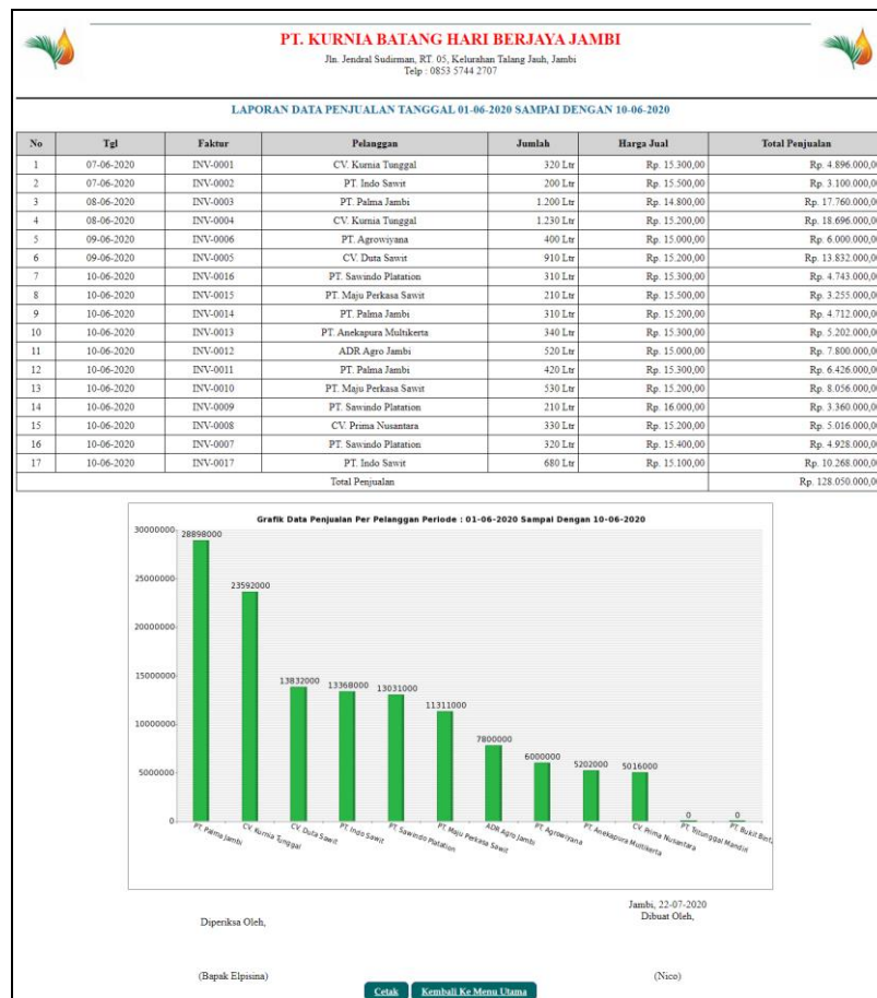
Gambar 5.9 Halaman Laporan Penjualan