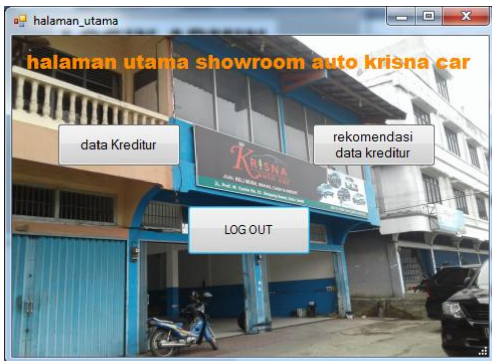
Gambar 5.2 halaman utama

Halaman ini terdiri dari 2 menu yang dapat digunakan untuk pengelolaan data dan proses hitung. Pada menu ini admin melakukan pengolahan data dan proses hitung. Listing program halaman utama ada pada lampiran, berikut tampilan halaman utama dapat dilihat pada gambar 5.2 sesuai dengan rancangan halaman utama pada gambar 4.10.