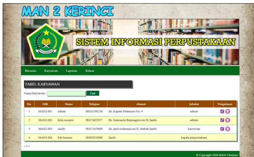
Gambar 5.2 Halaman Tabel Karyawan

Halaman tabel karyawan merupakan halaman yang menampilkan informasi mengenai nik, nama, telepon, alamat, jabatan dan pengaturan untuk mengubah dan menghapus data. Gambar 5.2 merupakan hasil implementasi dari rancangan tabel karyawan pada gambar 4.31.