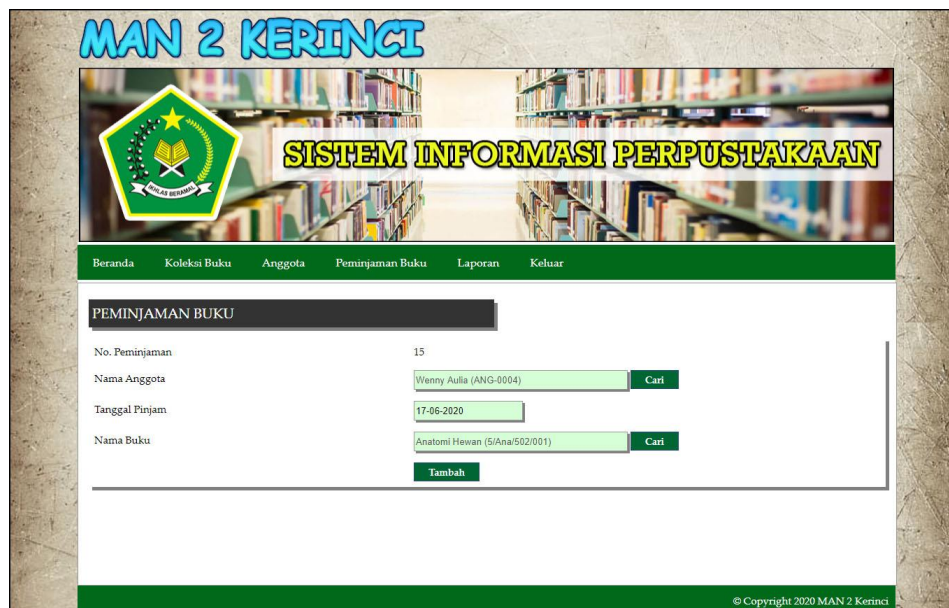
Gambar 5.18 Halaman Tambah Peminjaman Buku