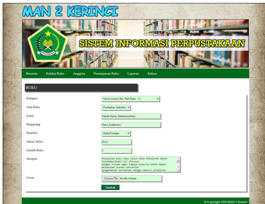
Gambar 5.16 Halaman Tambah Buku

Halaman tambah buku merupakan halaman yang menampilkan kolom-kolom yang dapat di input untuk menambah data buku pada sistem. Gambar 5.16 merupakan hasil implementasi dari rancangan tambah buku pada gambar 4.45.