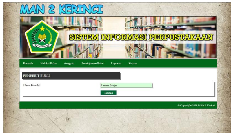
Gambar 5.15 Halaman Tambah Penerbit