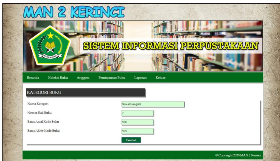
Gambar 5.14 Halaman Tambah Kategori Buku

Halaman tambah kategori buku merupakan halaman yang menampilkan kolom-kolom yang dapat di input untuk menambah data kategori buku pada sistem. Gambar 5.14 merupakan hasil implementasi dari rancangan tambah kategori buku pada gambar 4.43.