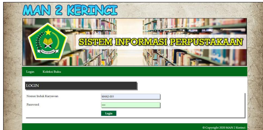
Gambar 5.12 Halaman Login