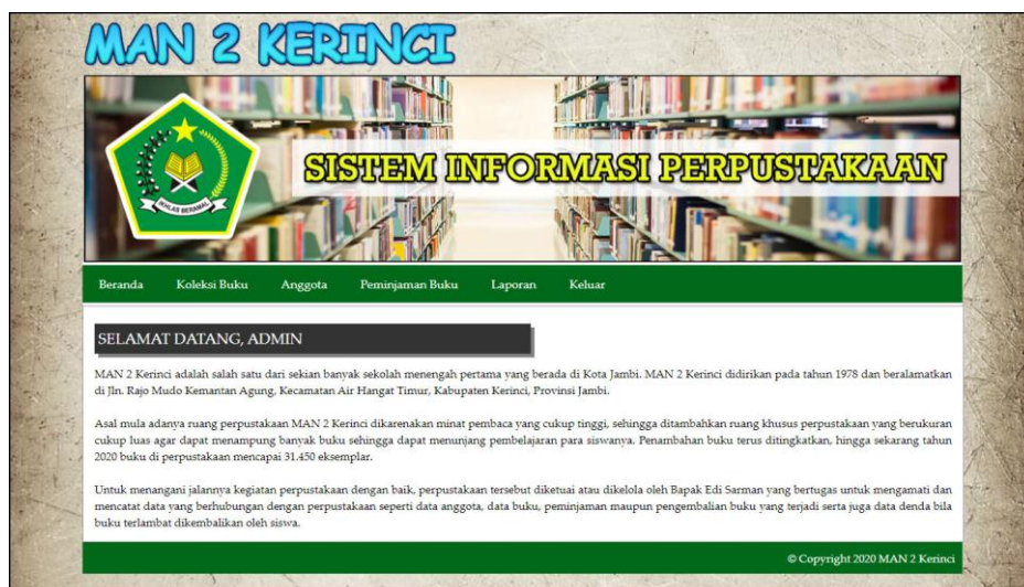
Gambar 5.1 Halaman Beranda

Halaman beranda merupakan halaman yang menampilkan informasi mengenai MAN 2 Kerinci dan terdapat menu-menu yang menghubungkan ke halaman lainnya. Gambar 5.1 merupakan hasil implementasi dari rancangan tabel pengunjung pada gambar 4.30.