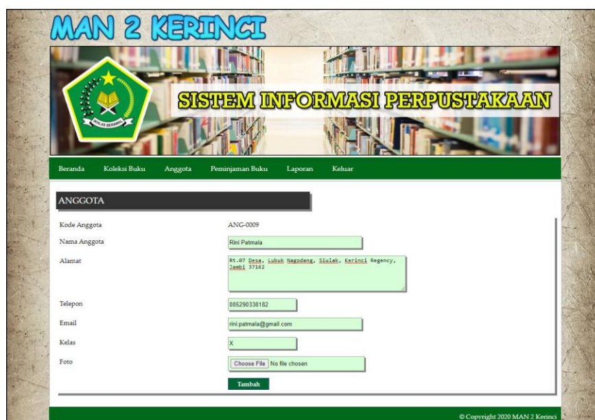
Gambar 5.17 Halaman Tambah Anggota

Halaman tambah anggota merupakan halaman yang menampilkan kolom-kolom yang dapat di input untuk menambah data anggota pada sistem. Gambar 5.17 merupakan hasil implementasi dari rancangan tambah anggota pada gambar 4.46.