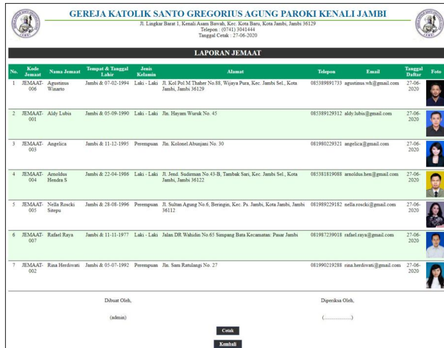
Gambar 5.8 Laporan Jemaat