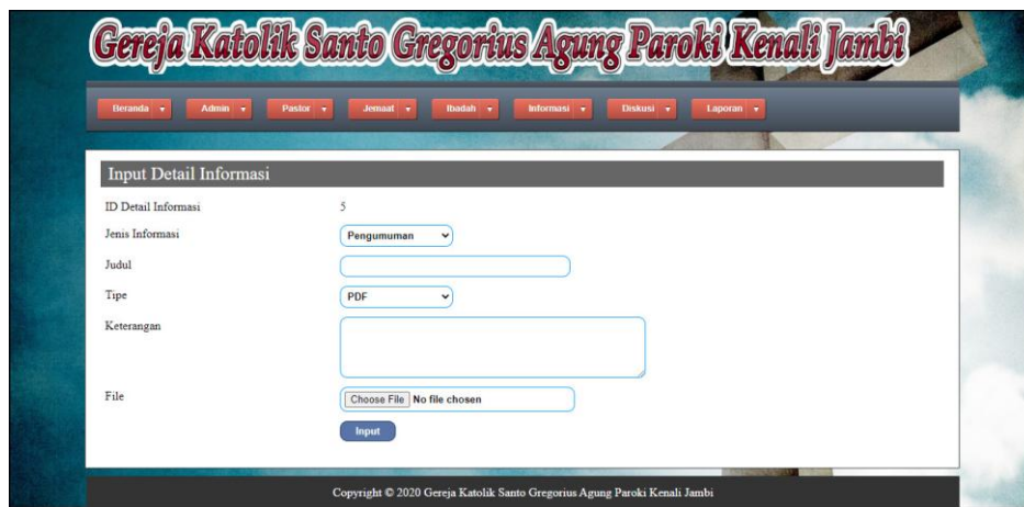
Gambar 5.20 Input Detail Informasi

Halaman input detail informasi merupakan halaman yang berisikan form yang digunakan untuk menambah data detail informasi pada sistem. Gambar 5.20 input detail informasi merupakan hasil implementasi dari rancangan pada gambar 4.58.