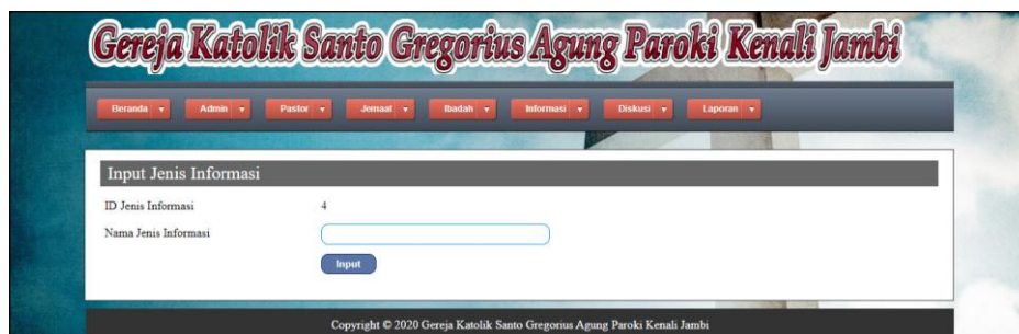
Gambar 5.19 Input Jenis Informasi

Halaman input jenis informasi merupakan halaman yang berisikan form yang digunakan untuk menambah data jenis informasi pada sistem. Gambar 5.19 input jenis informasi merupakan hasil implementasi dari rancangan pada gambar 4.57.