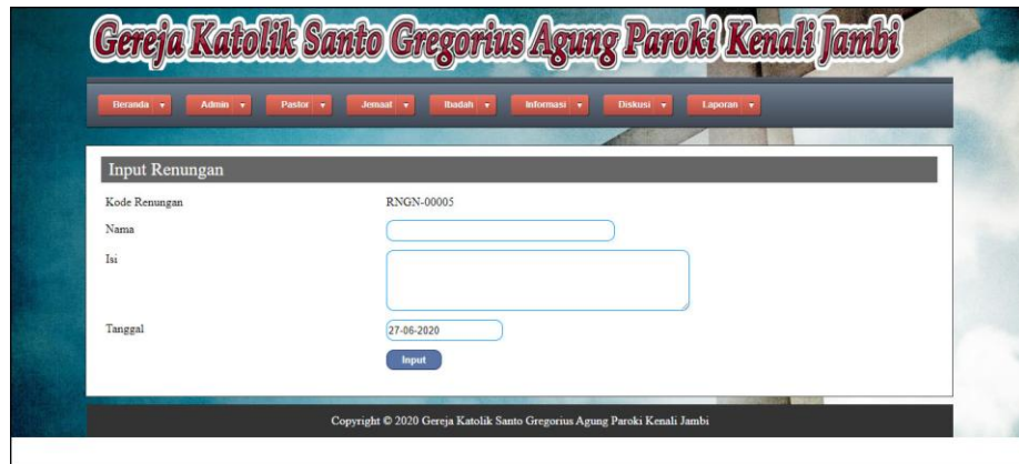
Gambar 5.18 Input Renungan

Halaman input renungan merupakan halaman yang berisikan form yang digunakan untuk menambah data renungan pada sistem. Gambar 5.18 input renungan merupakan hasil implementasi dari rancangan pada gambar 4.56.