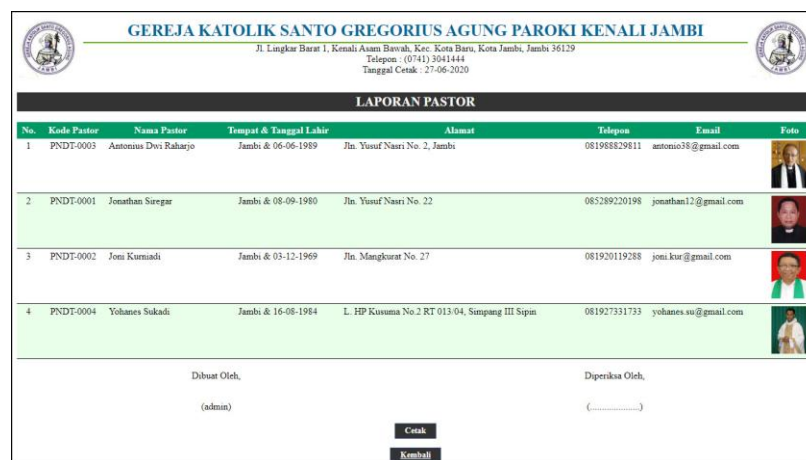
Gambar 5.9 Laporan Pastor

Halaman laporan pastor merupakan halaman yang menampilkan data pastor yang telah diinput dan terdapat tombol untuk mencetak laporan sesuai dengan kebutuhannya. Gambar 5.9 laporan pastor merupakan hasil implementasi dari rancangan pada gambar 4.47.