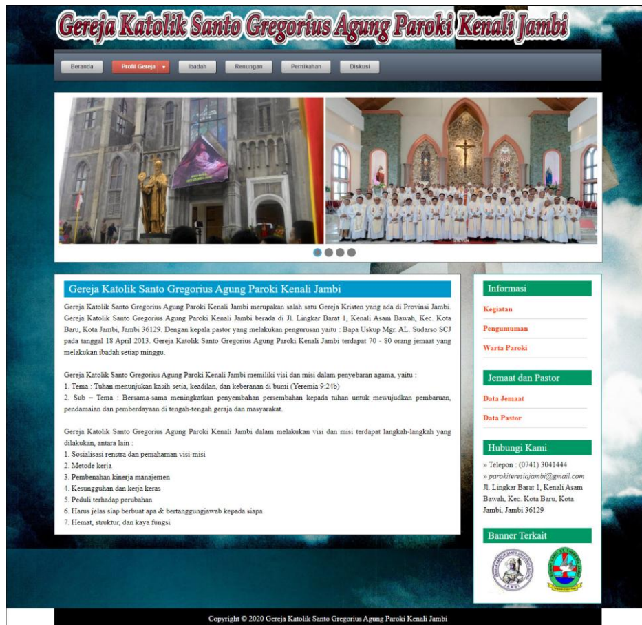
Gambar 5.1 Beranda Pengunjung