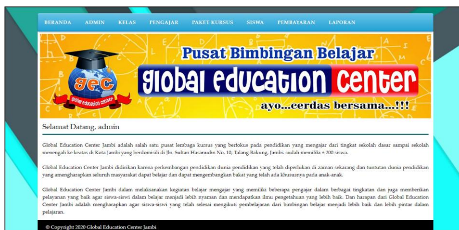
Gambar 5.7 Halaman Beranda

Halaman beranda menampilkan informasi mengenai data Global Education Center Jambi dan juga terdapat menu-menu dan sub menu untuk membuka ke halaman lainnya. Gambar 5.7 beranda merupakan hasil implementasi dari rancangan pada gambar 4.31.