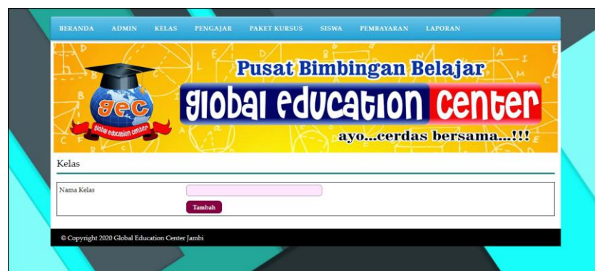
Gambar 5.3 Halaman Tambah Kelas

Halaman tambah kelas berisikan form untuk menambah kelas baru yang terdapat field nama kelas yang wajib diisi di dalam sistem. Gambar 5.3 tambah kelas merupakan hasil implementasi dari rancangan pada gambar 4.27