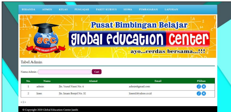
Gambar 5.8 Halaman Data Admin