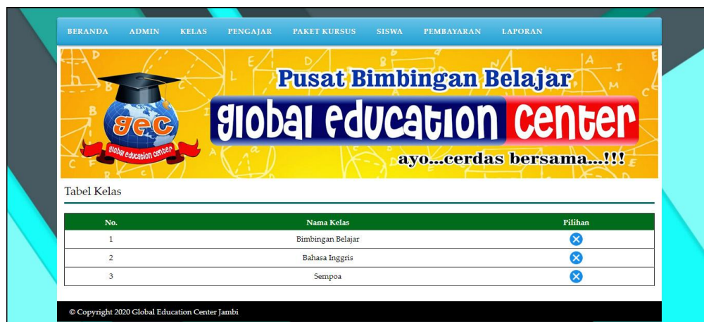
Gambar 5.9 Halaman Data Kelas

Gambar 5.9 data admin merupakan hasil implementasi dari rancangan pada gambar 4.33