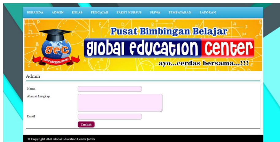
Gambar 5.2 Halaman Tambah Admin

Halaman tambah admin berisikan form untuk menambah admin baru yang terdapat field nama, alamat lengkap dan email yang wajib diisi di dalam sistem. Gambar 5.2 tambah admin merupakan hasil implementasi dari rancangan pada gambar 4.26