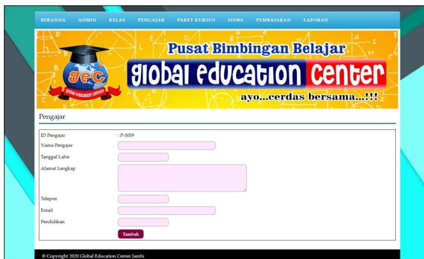
Gambar 5.4 Halaman Tambah Pengajar

Halaman tambah pengajar berisikan form untuk menambah pengajar baru yang terdapat field nama pengajar, tanggal lahir, alamat lengkap, telepon, email, dan pendidikan yang wajib diisi di dalam sistem. Gambar 5.4 tambah pengajar merupakan hasil implementasi dari rancangan pada gambar 4.28.