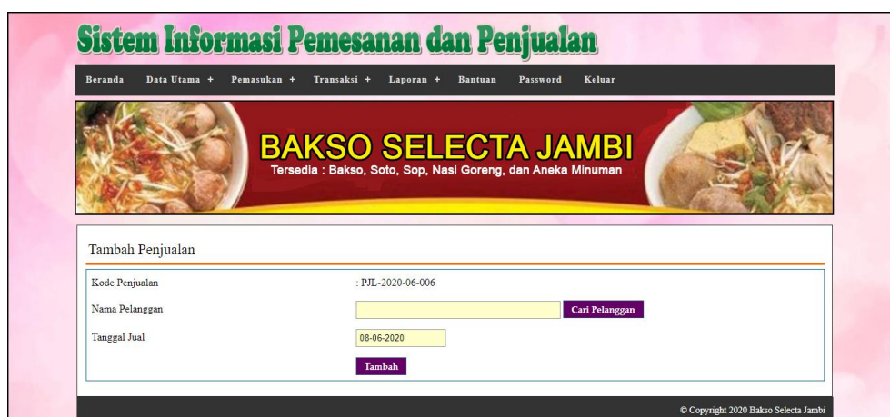
Gambar 5.12 Tambah Penjualan

Halaman tambah penjualan merupakan halaman yang digunakan untuk menambah data penjualan baru dengan nama pelanggan dan tanggal jual pada sistem. Gambar 5.12 tambah penjualan merupakan hasil implementasi dari rancangan pada gambar 4.40.