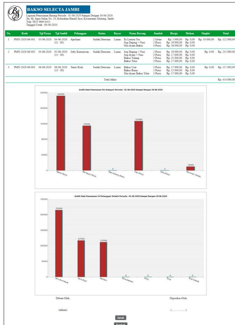
Gambar 5.9 Laporan Pemesanan Barang