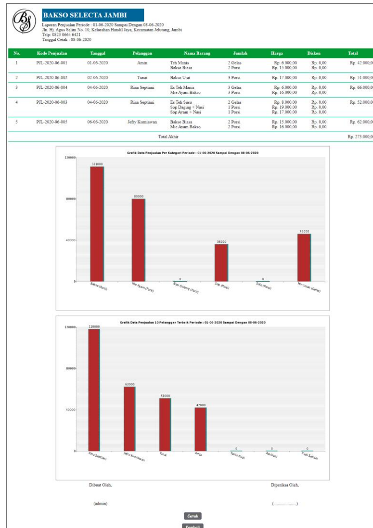
Gambar 5.8 Laporan Penjualan