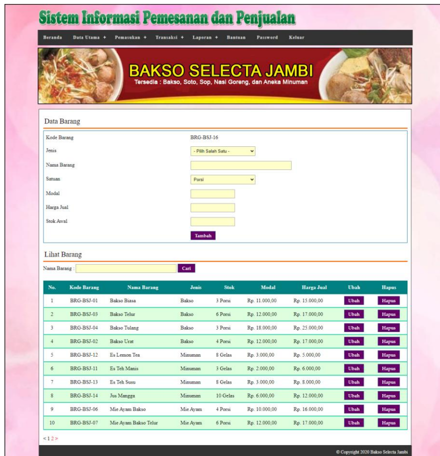
Gambar 5.16 Data Barang