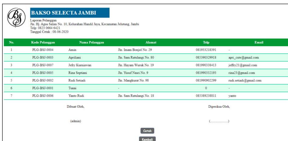
Gambar 5.5 Laporan Pelanggan

Halaman laporan pelanggan merupakan tampilan yang berisikan informasi mengenai data pelanggan yang telah diinput ke dalam sistem dan terdapat tombol untuk mencetak laporan sesuai dengan keinginan pengguna sistem. Gambar 5.5 laporan pelanggan merupakan hasil implementasi dari rancangan pada gambar 4.33.