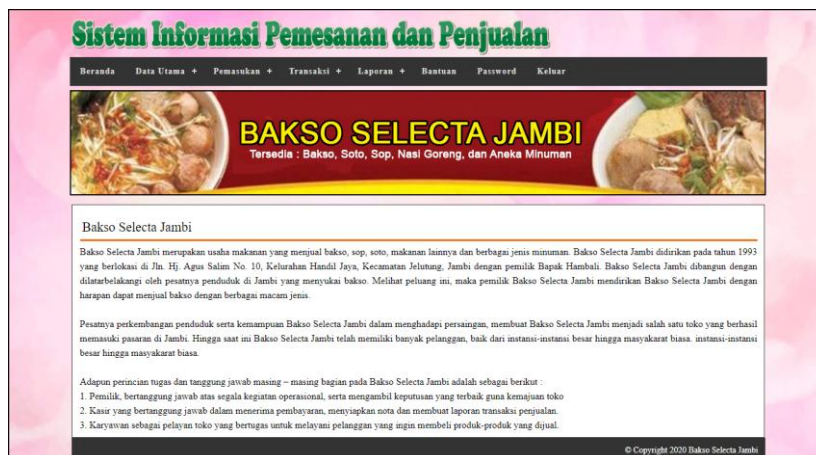
Gambar 5.1 Beranda

Halaman beranda merupakan tampilan awal digunakan pengguna sistem setelah melakukan login dengan dapat mengakses ke halaman lainnya dan terdapat menu-menu untuk menampilkan halaman lainnya. Gambar 5.1 beranda merupakan hasil implementasi dari rancangan pada gambar 4.29.