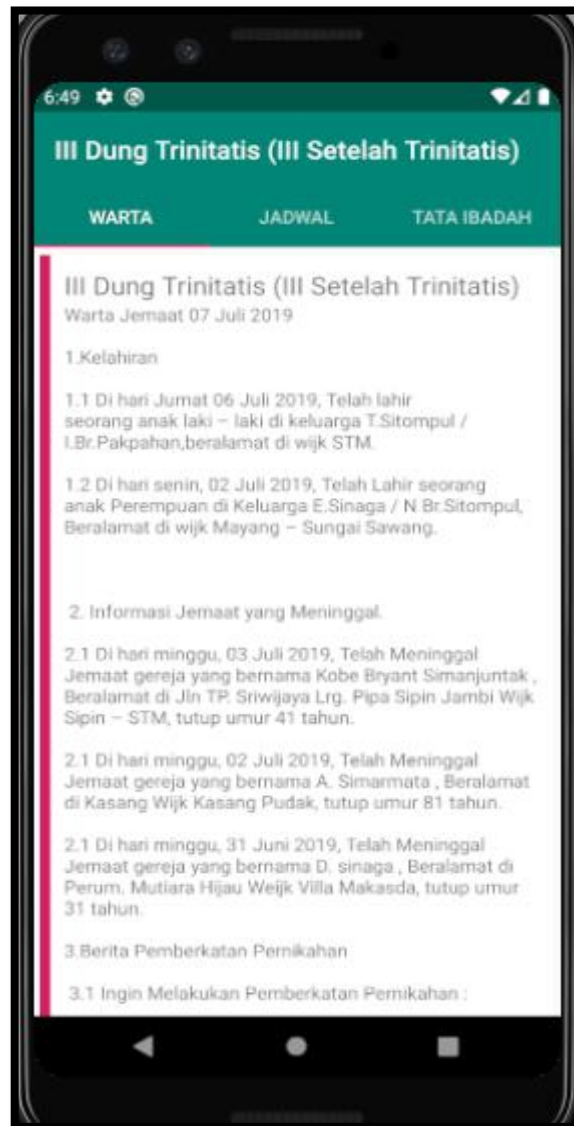
Gambar 5.7 Tampilan List Warta