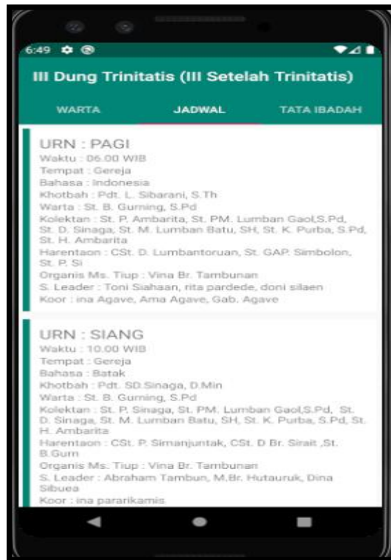
Gambar 5.6 Tampilan List Jadwal