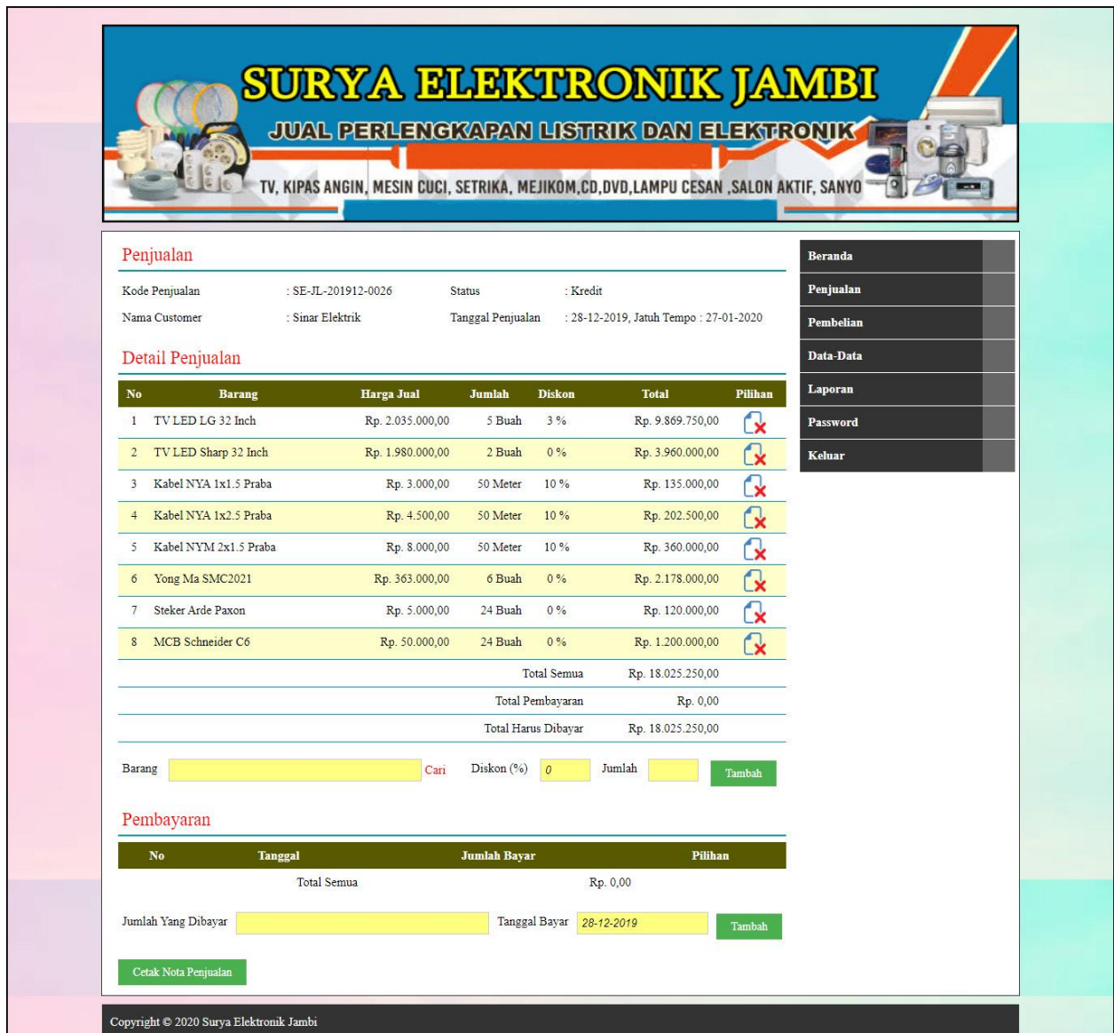
Gambar 5.17 Detail Penjualan