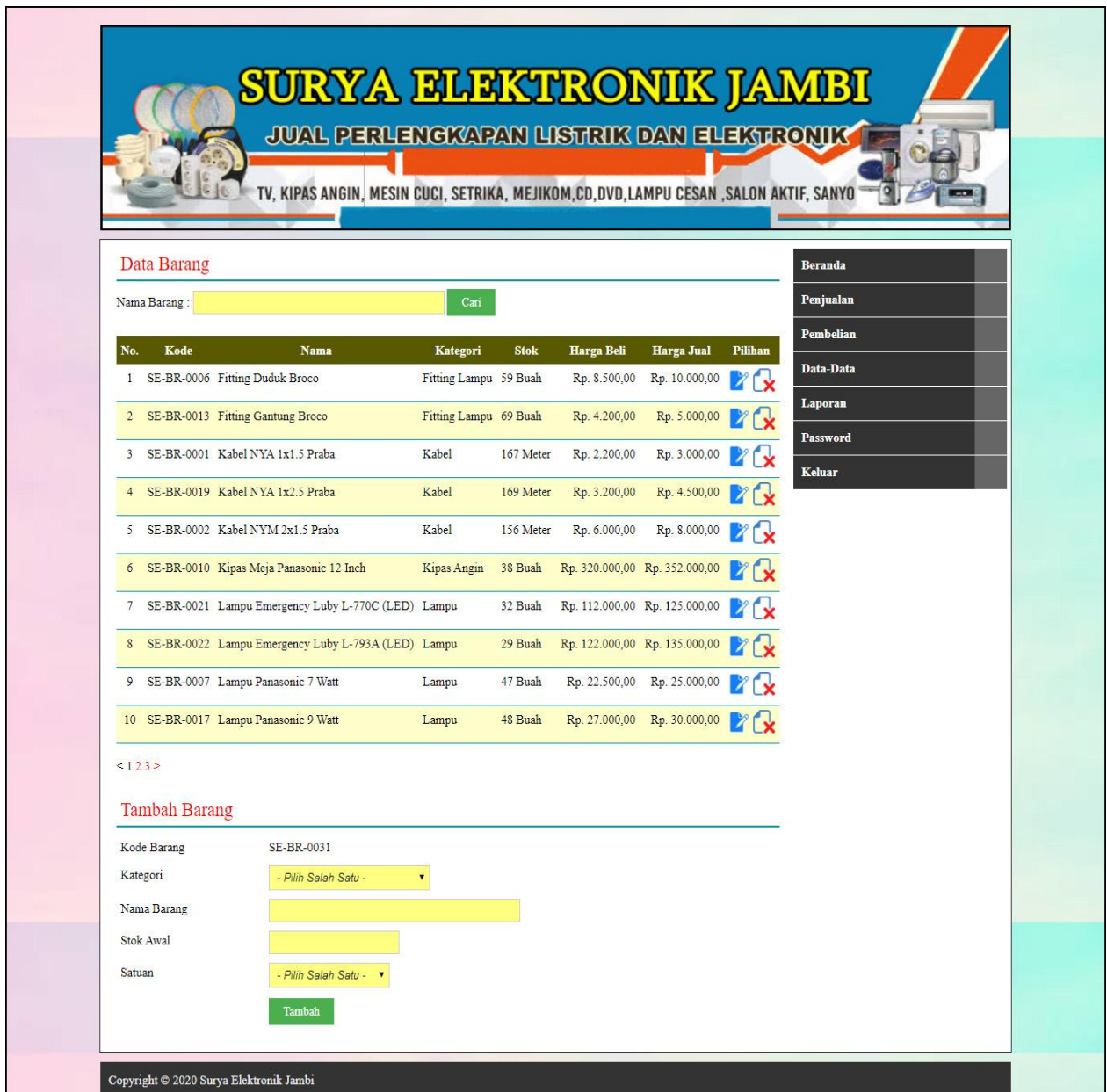
Gambar 5.13 Data Barang