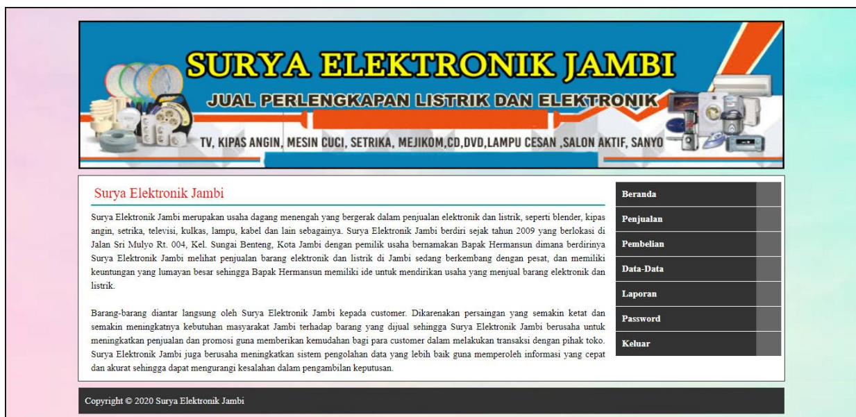
Gambar 5.1 Beranda

Halaman beranda merupakan halaman pertama setelah melakukan login dimana halaman ini menampilkan gambaran umum dari Surya Elektronik Jambi dan terdapat menu-menu untuk menampilkan informasi yang lain. Gambar 5.1 beranda admin merupakan hasil implementasi dari rancangan pada gambar 4.36