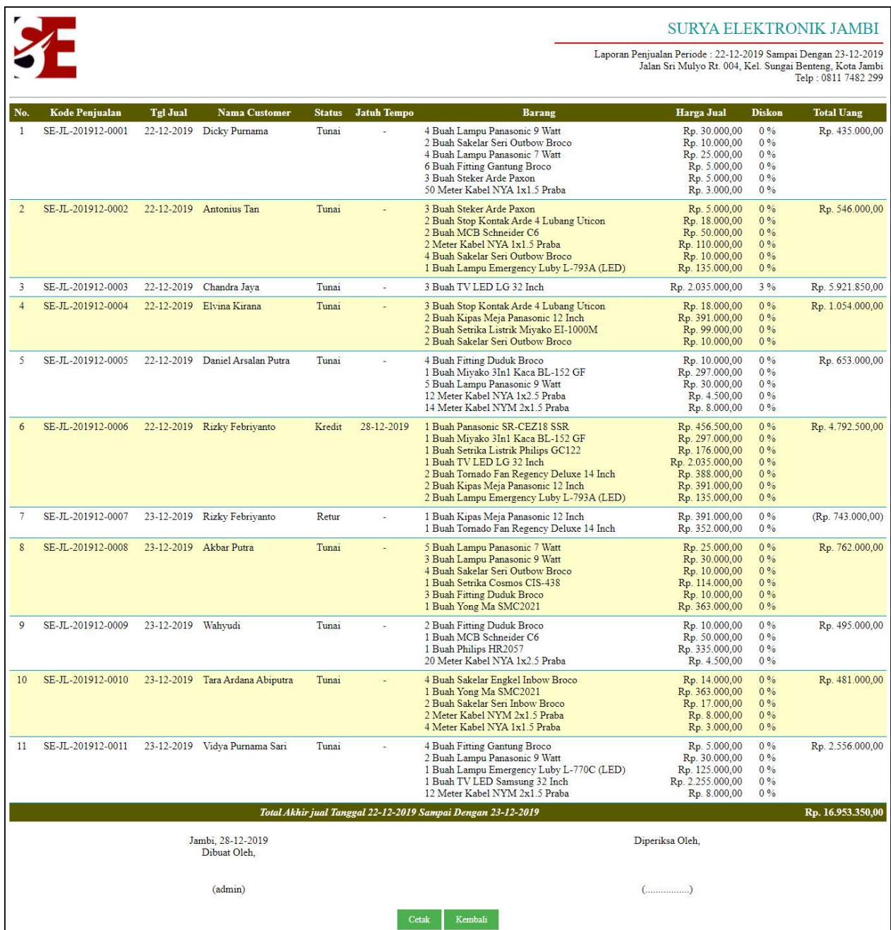
Gambar 5.6 Laporan Penjualan