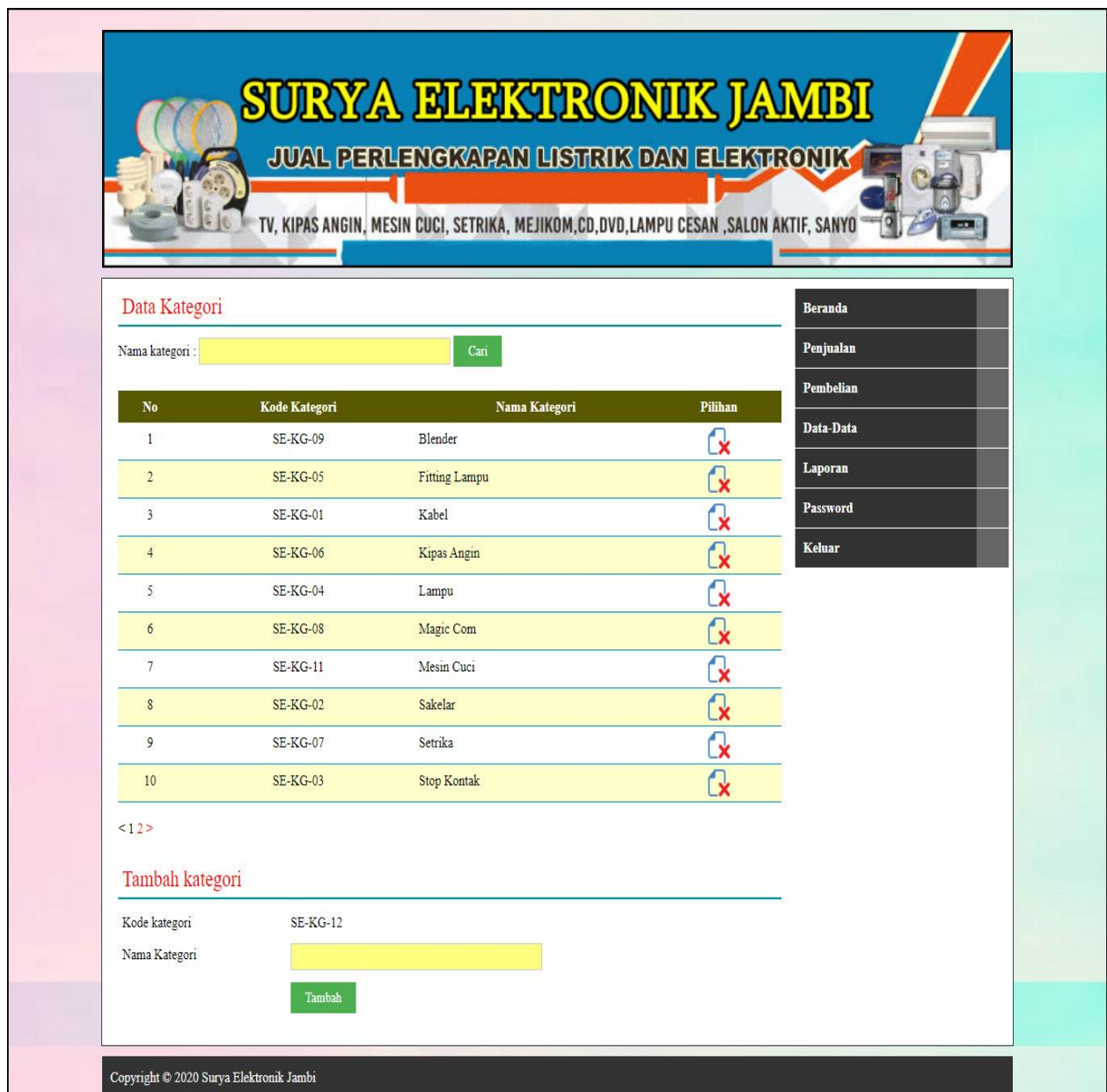
Gambar 5.12 Data Kategori