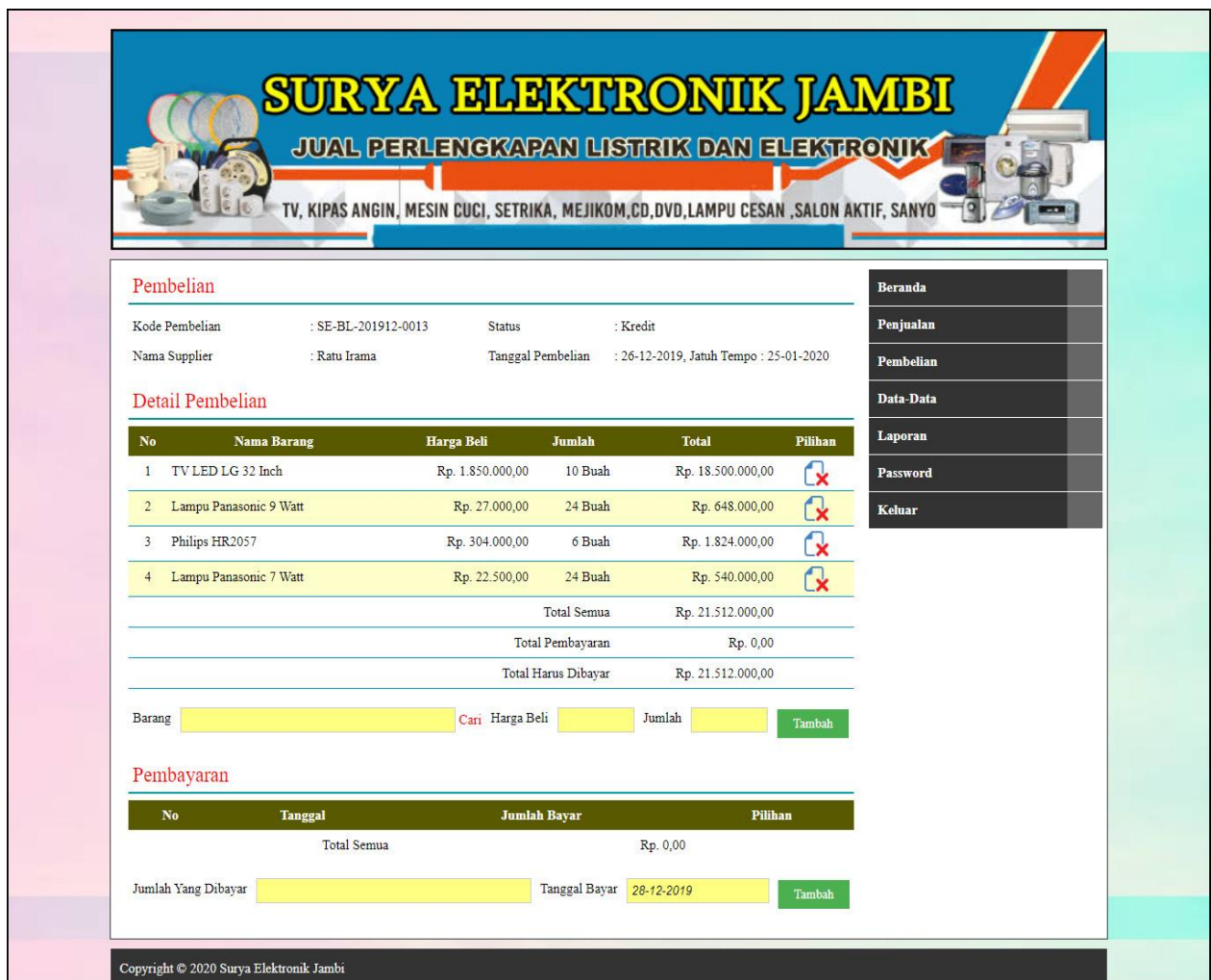
Gambar 5.15 Detail Pembelian