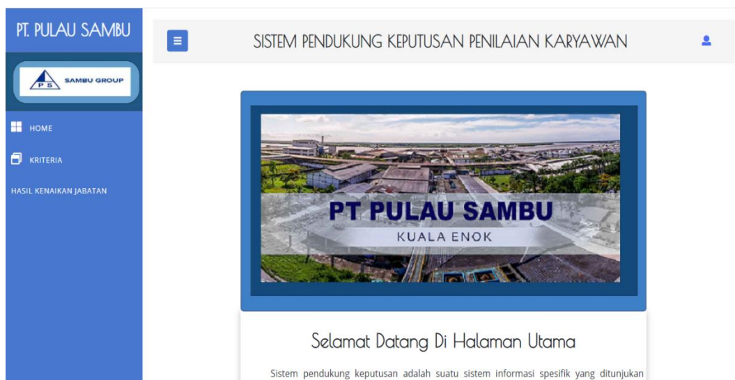
Gambar 5.14 Tampilan Halaman Home Page Karyawan

Halaman tampil home page karyawan merupakan halaman awal saat karyawan login kedalam sistem. Halaman ini menampilkan informasi data kriteria dan informasi hasil kenaikan jabatan. Gambar 5.14 merupakan hasil implementasi dari rancangan halaman home page karyawan pada Gambar 4.43.