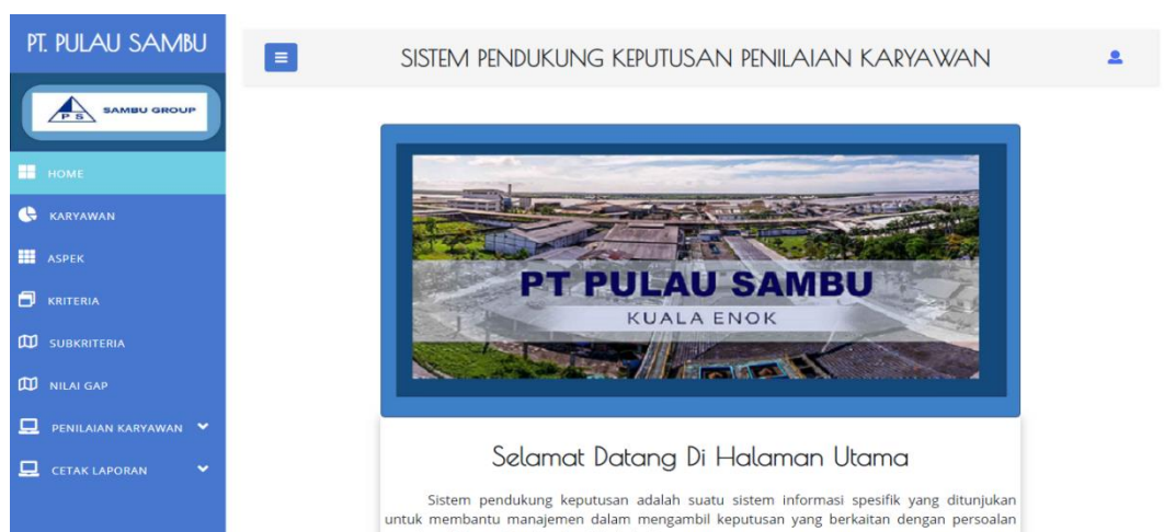
Gambar 5.1 Tampilan Beranda Admin

Halaman beranda admin adalah halaman yang pertama kali tampil ketika admin berhasil login kedalam sistem. Halaman ini menampilkan menu-menu yang mendukung sistem penunjang keputusan penilaian karyawan untuk kenaikan jabatan pada PT. Pulau Sambu Kuala Enok. Gambar 5.1 merupakan hasil implementasi dari rancangan beranda admin pada Gambar 4.30.