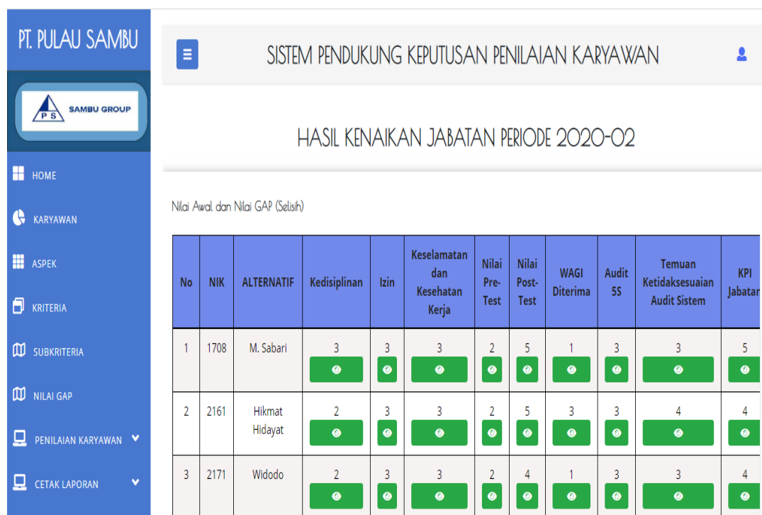
Gambar 5.8 Tampilan Halaman Tampil Hasil Kenaikan Jabatan

Halaman tampil hasil kenaikan jabatan ini merupakan halaman yang menampilkan seluruh hasil perhitungan dari proses penilaian kinerja karyawan untuk kenaikan jabatan dengan metode profile matching . Gambar 5.8 merupakan hasil implementasi dari rancangan halaman tampil hasil kenaikan jabatan pada Gambar 4.37.