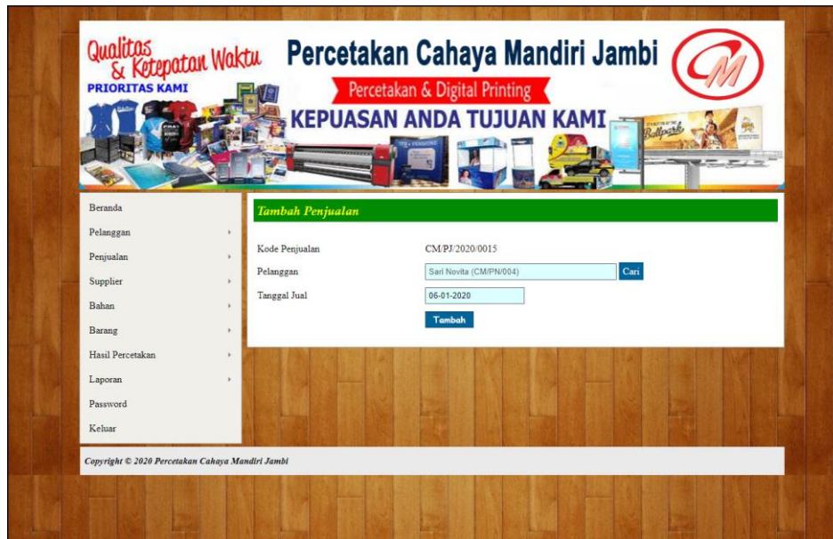
Gambar 5.14 Tambah Penjualan