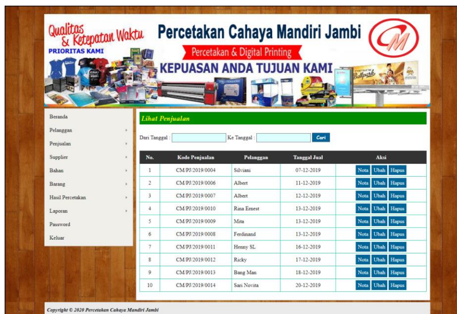
Gambar 5.2 Lihat Penjualan

Gambar 5.2 lihat penjualan merupakan hasil implementasi dari rancangan pada gambar 4.37.