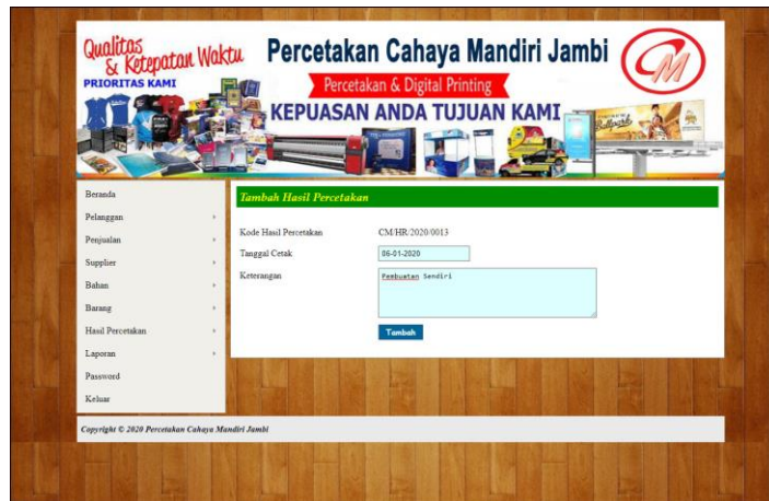
Gambar 5.22 Tambah Hasil Percetakan