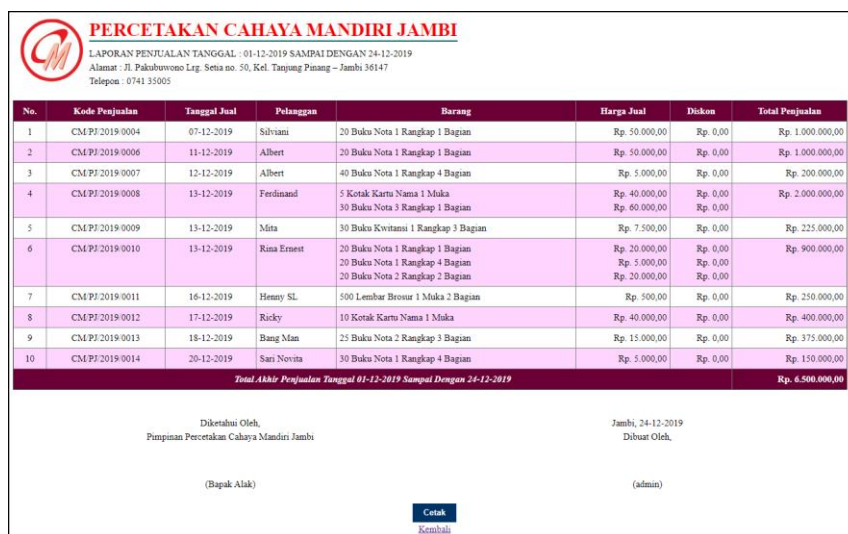
Gambar 5.6 Laporan Penjualan

halaman laporan penjualan merupakan halaman yang berisikan informasi mengenai data penjualan yang telah diinput dan terdapat tombol untuk mencetak laporan tersebut. Gambar 5.6 laporan penjualan merupakan hasil implementasi dari rancangan pada gambar 4.41.