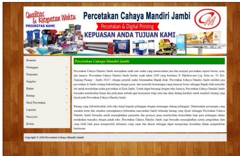
Gambar 5.1 Beranda