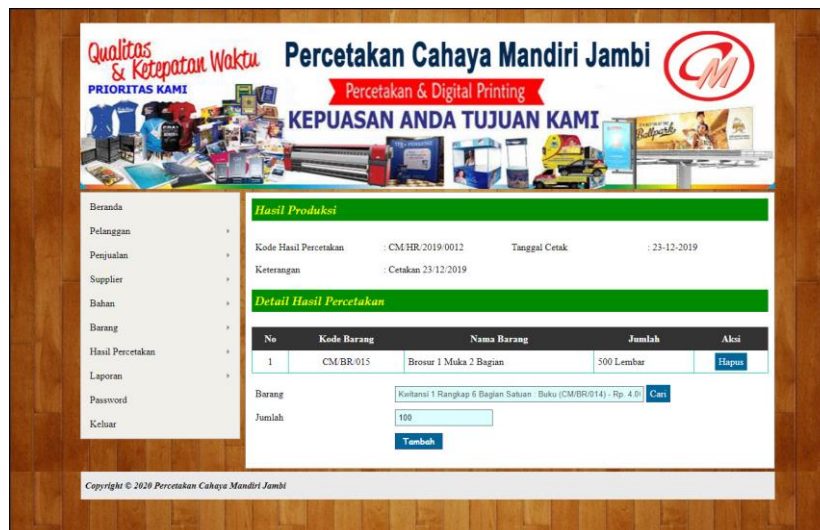
Gambar 5.23 Detail Hasil Percetakan

Halaman detail hasil percetakan merupakan halaman yang menampilkan form untuk menambah detail hasil percetakan dengan menginput barang dan jumlah dan terdapat informasi mengenai hasil percetakan. Gambar 5.23 detail hasil percetakan merupakan hasil implementasi dari rancangan pada gambar 4.58.