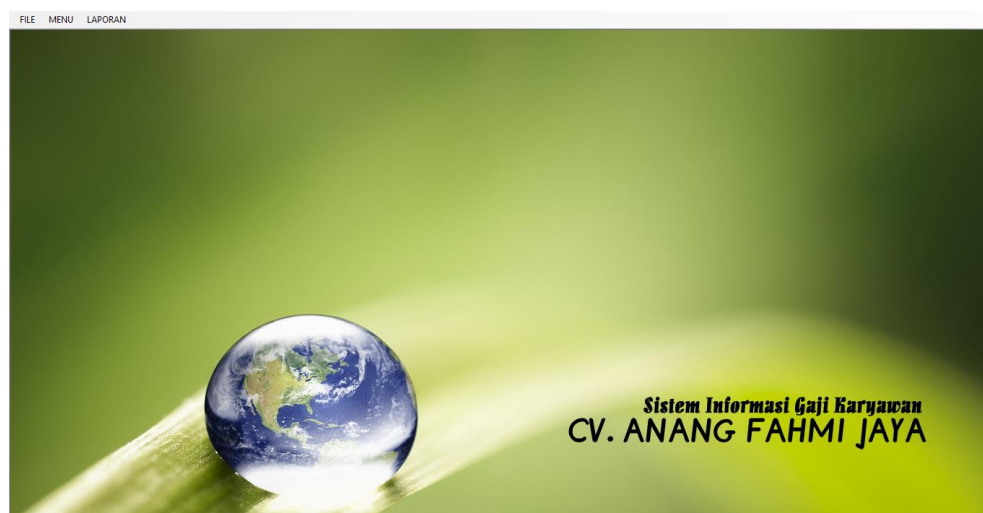
Gambar 5.2 Tampilan Halaman Menu Utama

Tampilan form menu utama merupakan tampilan form yang digunakan untuk masuk kedalam sistem. Berikut ini merupakan tampilan halaman menu utama yang merupakan implementasi dari rancangan input menu utama pada gambar 4.22