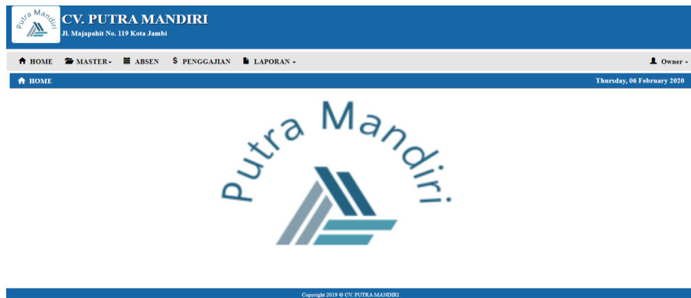
Gambar 5.1 Halaman Home

Melalui halaman home ini pengguna dapat mengakses halaman-halaman yang lain. Halaman home ini menghubungkan pengguna ke sub sistem yang diinginkan. Gambar 5.1 merupakan hasil implementasi dari rancangan pada gambar 4.26.