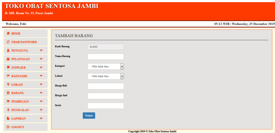
Gambar 5.19 Halaman Tambah Barang

Halaman tambah barang merupakan halaman yang digunakan oleh pengguna sistem untuk menambah data barang baru ke dalam sistem. Gambar 5.19 merupakan hasil implementasi dari rancangan pada gambar 4.49.