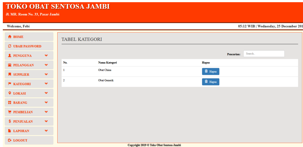
Gambar 5.5 Halaman Tabel Kategori

Halaman table kategori merupakan halaman yang dapat diakses oleh pengguna sistem untuk mengelola data kategori dengan berisikan informasi mengenai nama, dari kategori serta terdapat link untuk menghapus data kategori sesuai dengan kebutuhan. Gambar 5.5 merupakan hasil implementasi dari rancangan pada gambar 4.35.