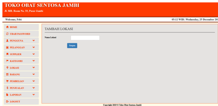
Gambar 5.18 Halaman Tambah Lokasi

Halaman tambah lokasi merupakan halaman yang digunakan oleh pengguna sistem untuk menambah data lokasi baru ke dalam sistem dengan dimana pengguna sistem diwajibkan mengisi nama lokasi pada field yang telah tersedia pada sistem. Gambar 5.18 merupakan hasil implementasi dari rancangan pada gambar 4.48.