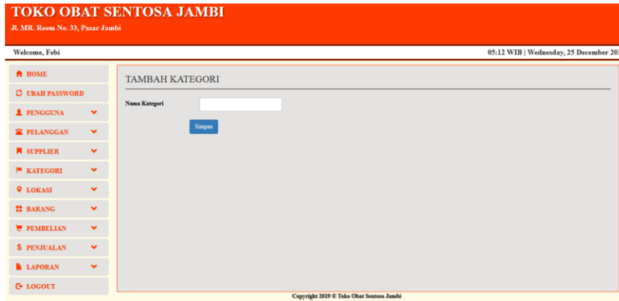
Gambar 5.17 Halaman Tambah Kategori