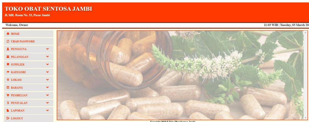
Gambar 5.1 Tampilan Halaman Home

Tampilan halaman home merupakan halaman yang berisikan informasi mengenai stock batas minimum dan terdapat menu dan link untuk membuka ke halaman lainnya. Gambar 5.1 merupakan hasil implementasi dari rancangan pada gambar 4.31.