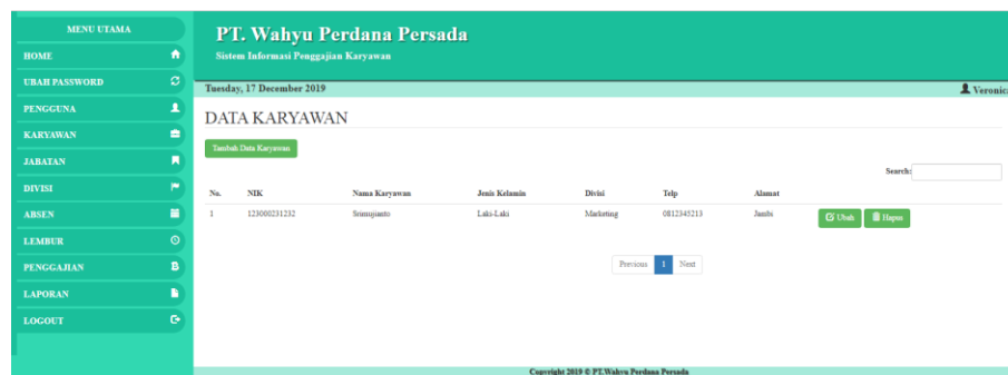
Gambar 5.3 Halaman Karyawan

Gambar 5.3 merupakan hasil implementasi dari rancangan pada gambar 4.26.