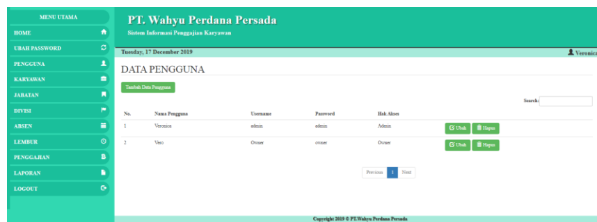
Gambar 5.2 Halaman Pengguna

Gambar 5.2 merupakan hasil implementasi dari rancangan pada gambar 4.25.