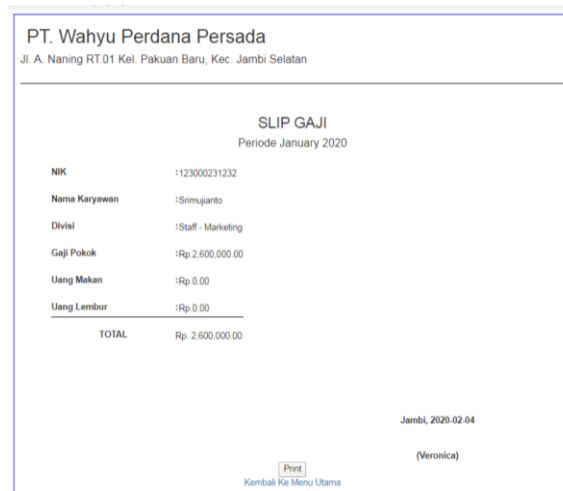
Gambar 5.11 Halaman Slip Gaji

Halaman slip gaji berisikan informasi mengenai slip gaji karyawan perhari atau perbulan. Gambar 5.11 merupakan hasil implementasi dari rancangan pada gambar 4.34.