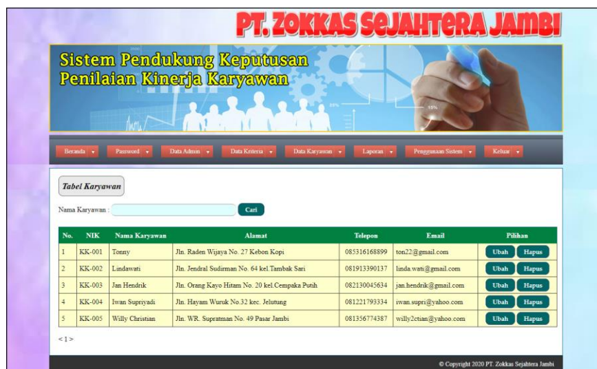
Gambar 5.8 Tabel Karyawan

Halaman tabel karyawan merupakan halaman yang menampilkan informasi lengkap dari karyawan dan terdapat pengaturan untuk mengubah dan menghapus data. Gambar 5.8 tabel karyawan merupakan hasil implementasi dari rancangan pada gambar 4.29.