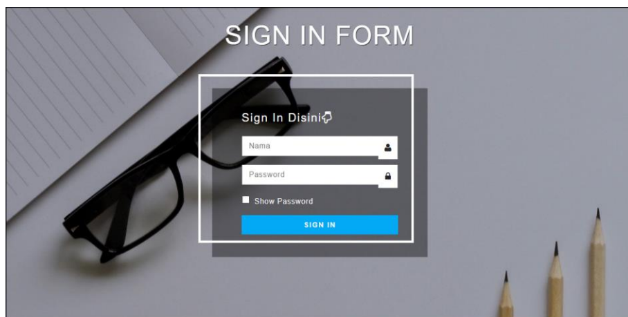
Gambar 5.1 Form Login

Halaman form login merupakan halaman yang digunakan oleh pengguna sistem untuk masuk ke halaman utama dengan mengisi nama dan password dengan benar. Gambar 5.1 form login merupakan hasil implementasi dari rancangan pada gambar 4.22.