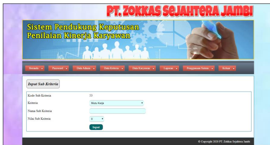
Gambar 5.5 Input Sub Kriteria

Halaman input sub kriteria merupakan halaman yang menampilkan form untuk menambah data sub kriteria baru dengan kolom yang terdiri dari kriteria, nama sub kriteria, dan nilai sub kriteria. Gambar 5.5 input sub kriteria merupakan hasil implementasi dari rancangan pada gambar 4.26.