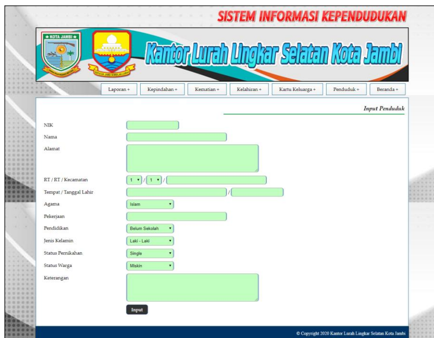
Gambar 5.9 Halaman Input Penduduk

Halaman input penduduk merupakan halaman yang digunakan untuk menambah data penduduk dengan mengisi data pada kolom yang tersedia. Gambar 5.9 tambah user merupakan hasil implementasi dari rancangan pada gambar 4.36