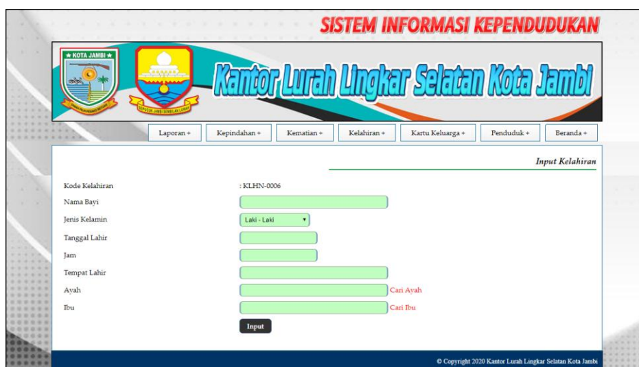
Gambar 5.12 Halaman Input Kelahiran

Halaman input kelahiran merupakan halaman yang digunakan untuk menambah data kelahiran dengan mengisi data pada kolom yang tersedia. Gambar 5.12 input kelahiran merupakan hasil implementasi dari rancangan pada gambar 4.39.