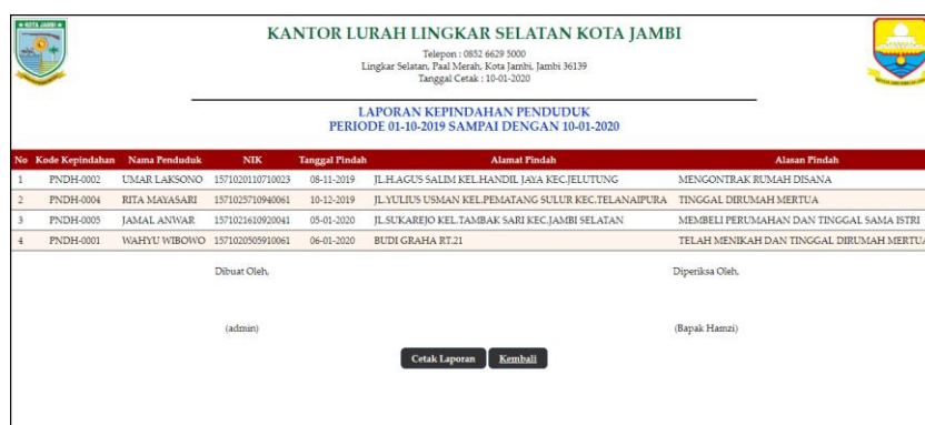
Gambar 5.6 Halaman Laporan Kepindahan

Halaman laporan kepindahan merupakan halaman yang digunakan untuk menampilkan informasi mengenai data kepindahan yang telah diinput dan terdapat tombol untuk mencetak sesuai dengan kebutuhannya. Gambar 5.6 laporan kepindahan merupakan hasil implementasi dari rancangan pada gambar 4.33.