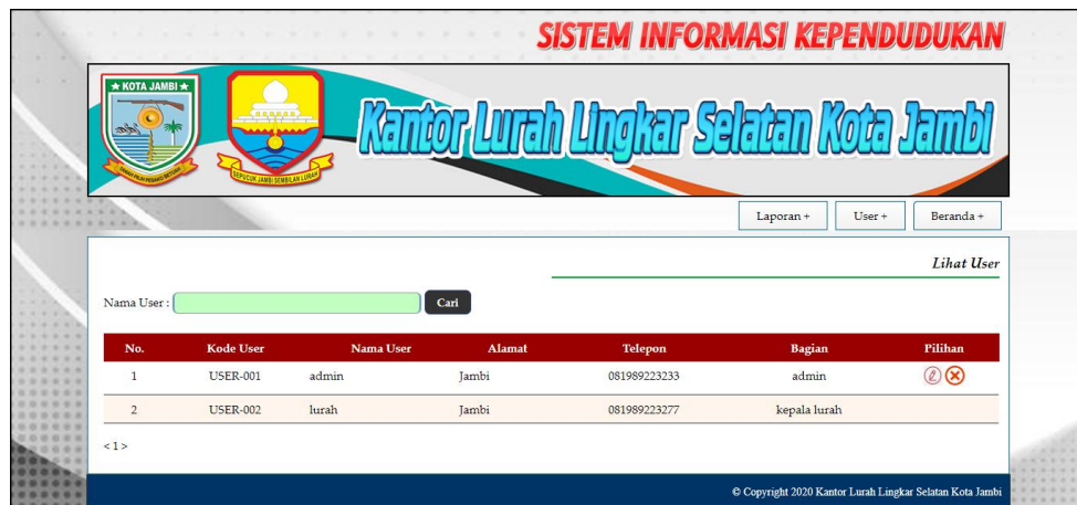
Gambar 5.7 Halaman Lihat User