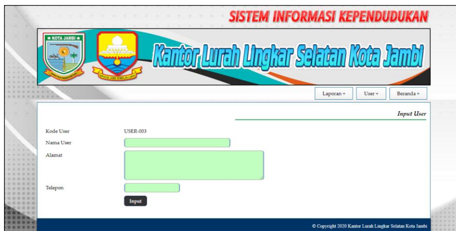
Gambar 5.15 Halaman Input User

Halaman input user merupakan halaman yang digunakan untuk menambah data user dengan mengisi data pada kolom yang tersedia. Gambar 5.15 input user merupakan hasil implementasi dari rancangan pada gambar 4.42.