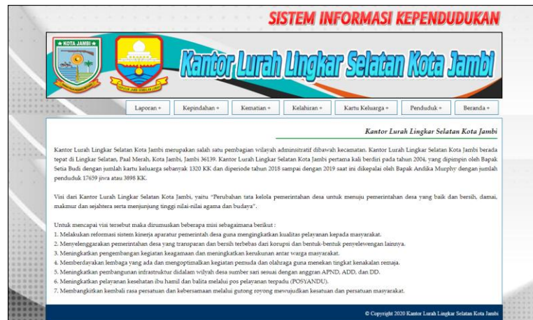
Gambar 5.1 Halaman Beranda