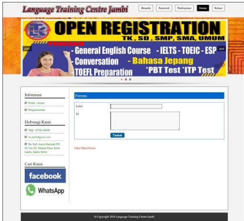
Gambar 5.15 Tampilan Forum