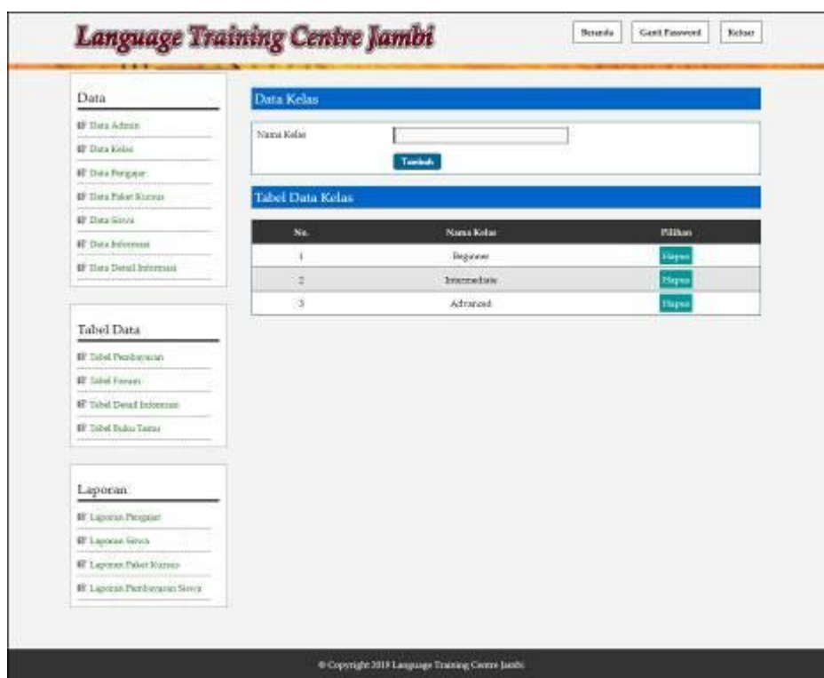
Gambar 5.18 Tampilan Data Kelas