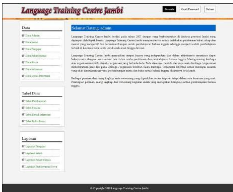
Gambar 5.7 Tampilan Beranda Admin