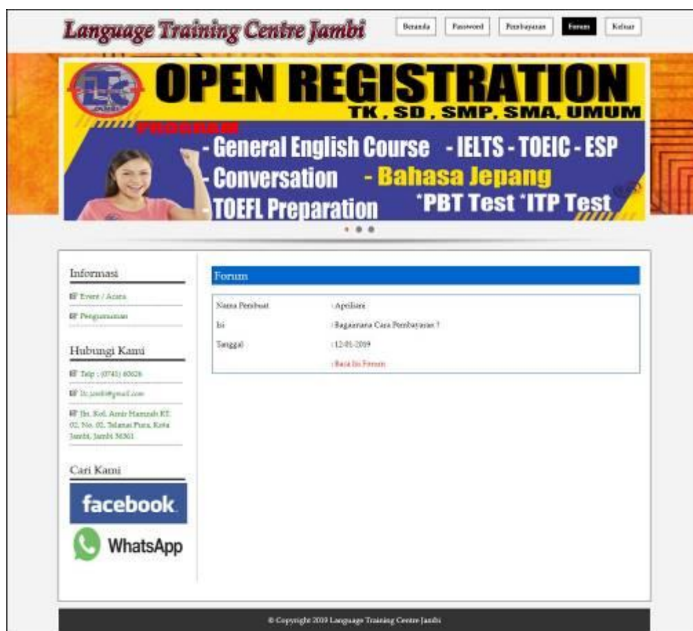
Gambar 5.6 Tampilan Melihat Forum