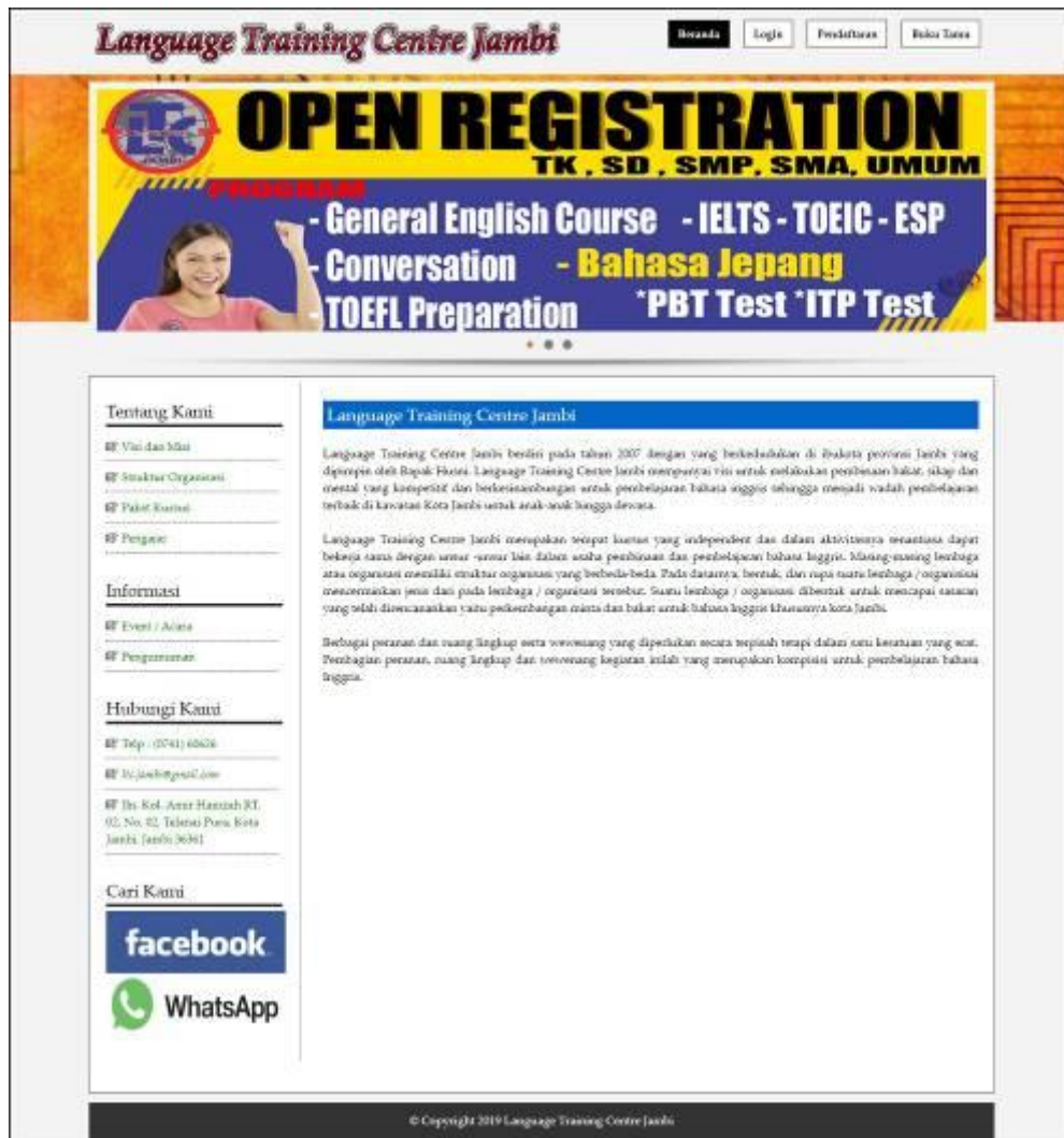
Gambar 5.1 Tampilan Beranda Pengunjung