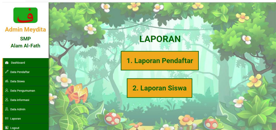
Gambar 5.10 Halaman Mencetak Laporan