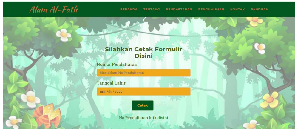
Gambar 5.14 Halaman Mencetak Formulir

Halaman mencetak formulir merupakan halaman yang dapat diakses oleh pengunjung untuk mencetak formulir. Gambar 5.14 merupakan hasil implementasi dari rancangan pada gambar 4.22