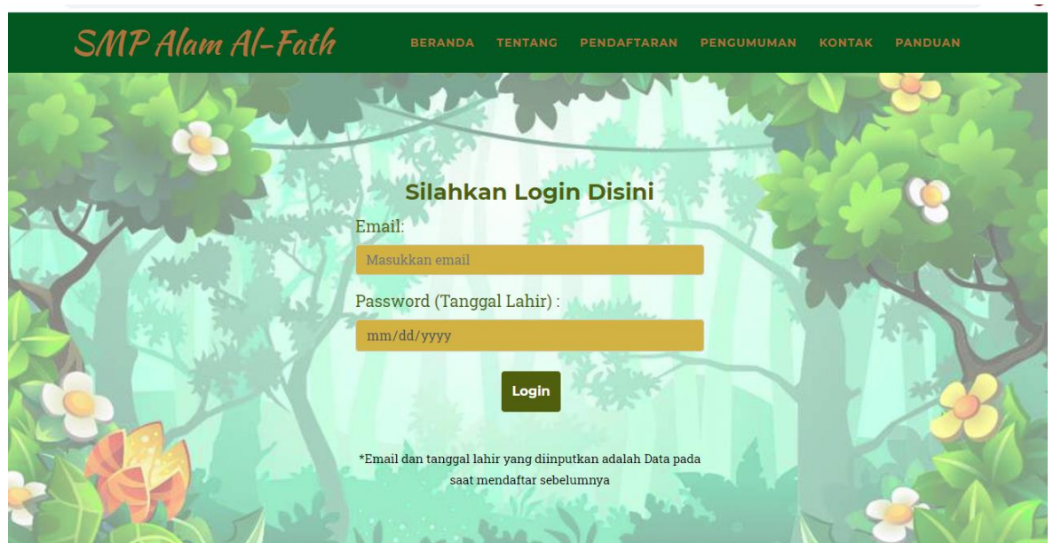
Gambar 5.15 Halaman Login Pendaftar

Halaman login pendaftar merupakan halaman yang digunakan oleh pendaftar untuk login.