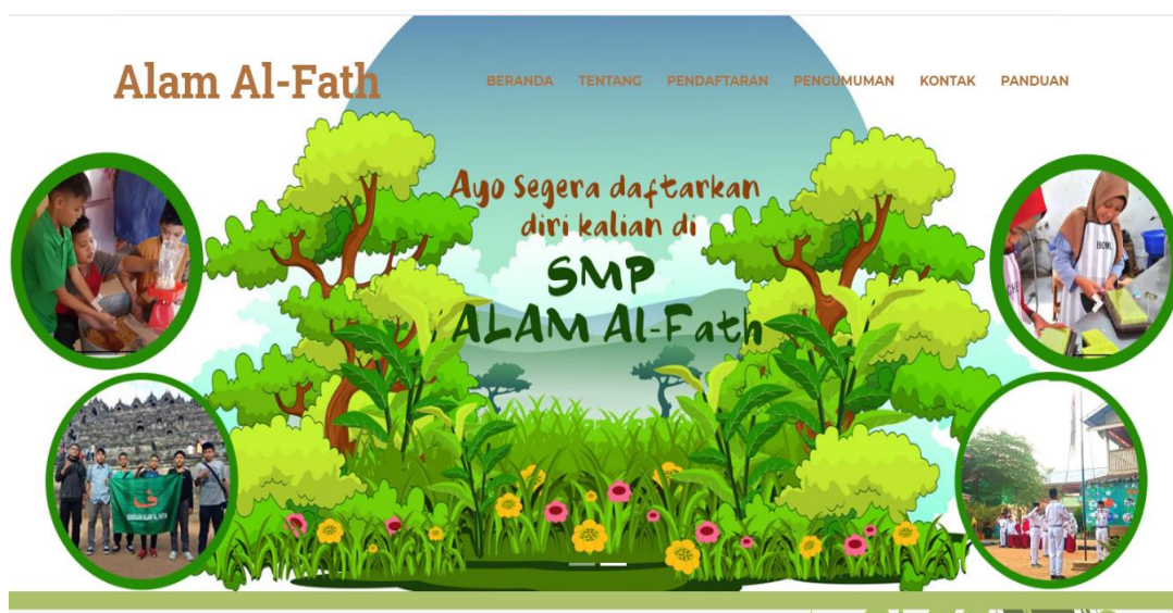
Gambar 5.1 Halaman Home

Halaman home merupakan halaman yang menghubungkan antara sub-menu satu dengan sub-menu lainnya. Gambar 5.1 merupakan hasil implementasi dari rancangan pada gambar 4.25