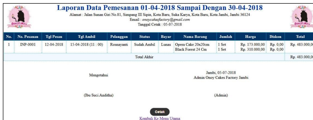
Gambar 5.13 Laporan Pemesanan Barang Telah Diambil

Halaman laporan pemesanan barang telah diambil menampilkan informasi mengenai pemesanan produk yang telah diambil oleh pelanggan dengan detail dari produk yang telah dipesan. Gambar 5.13 laporan pemesanan barang belum diambil merupakan hasil implementasi dari rancangan pada gambar 4.42