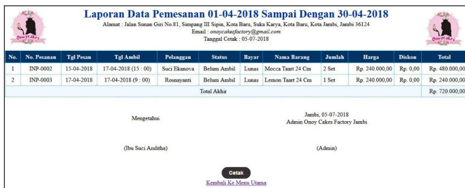
Gambar 5.12 Laporan Pemesanan Barang Belum Diambil

Halaman laporan pemesanan barang belum diambil menampilkan informasi mengenai pemesanan produk yang belum diambil oleh pelanggan dengan detail dari produk yang telah dipesan. Gambar 5.12 laporan pemesanan barang belum diambil merupakan hasil implementasi dari rancangan pada gambar 4.41