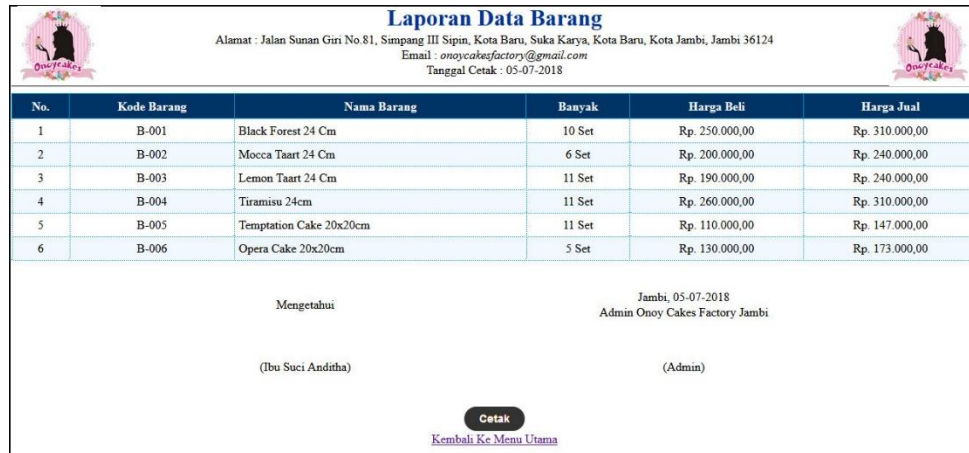
Gambar 5.12 Laporan Persediaan Barang