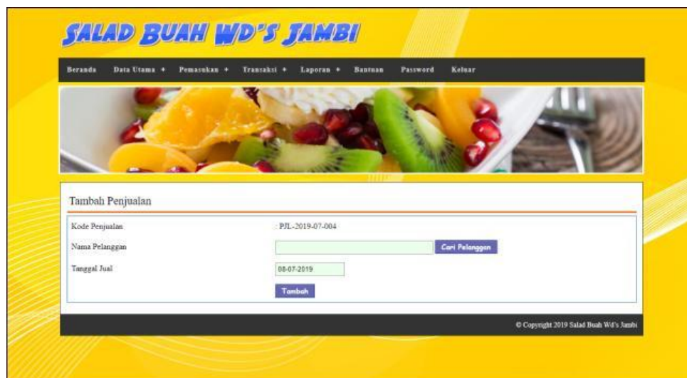
Gambar 5.12 Tambah Penjualan