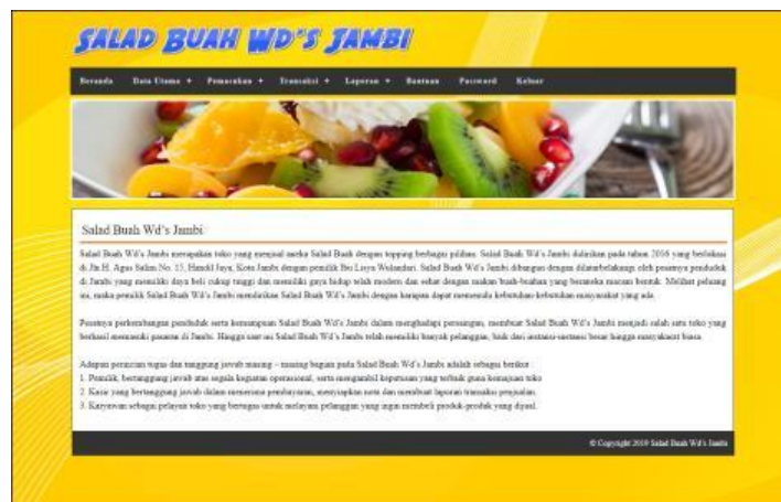
Gambar 5.1 Beranda

Halaman beranda merupakan tampilan awal digunakan pengguna sistem setelah melakukan login dengan dapat mengakses ke halaman lainnya dan terdapat menu-menu untuk menampilkan halaman lainnya. Gambar 5.1 beranda merupakan hasil implementasi dari rancangan pada gambar 4.27.