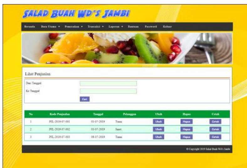
Gambar 5.2 Lihat Penjualan

Halaman lihat penjualan merupakan tampilan yang berisikan informasi mengenai data penjualan dan terdapat tombol untuk mengubah, menghapus dan mencetak data penjualan pada sistem. Gambar 5.2 lihat penjualan merupakan hasil implementasi dari rancangan pada gambar 4.28