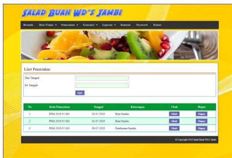
Gambar 5.4 Lihat Barang masuk

Halaman lihat barang masuk merupakan tampilan yang berisikan informasi mengenai data barang masuk dan terdapat tombol untuk mengubah dan menghapus data barang masuk pada sistem. Gambar 5.4 lihat barang masuk merupakan hasil implementasi dari rancangan pada gambar 4.30.