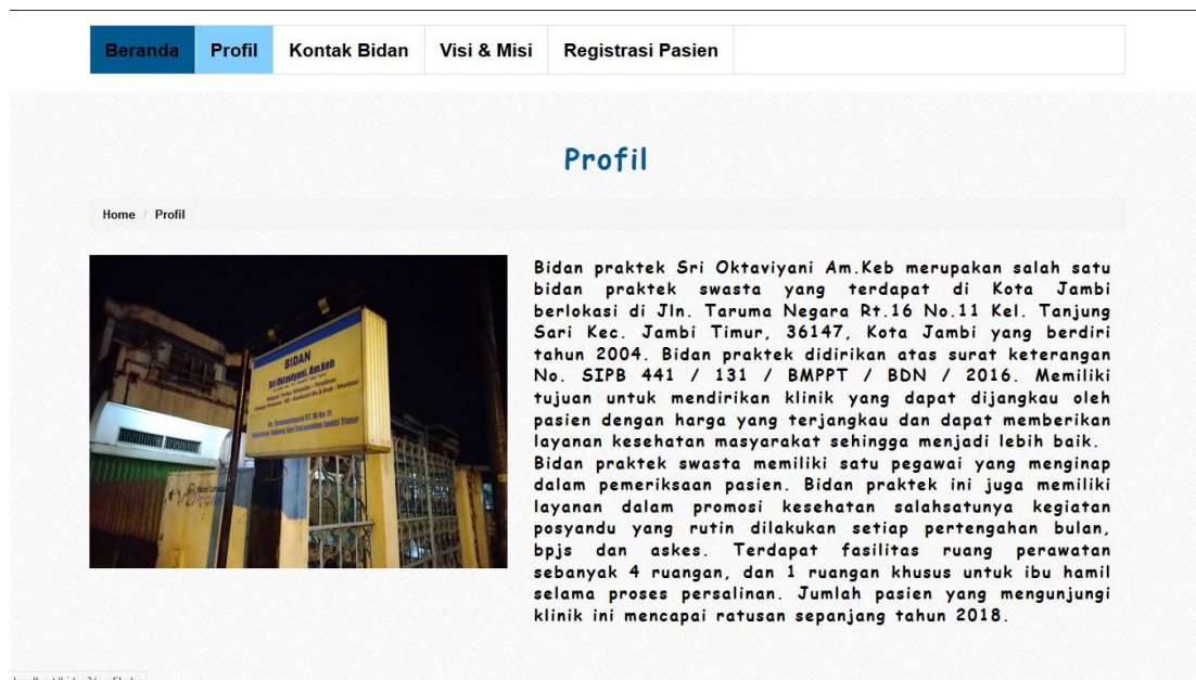
Gambar 5.2 Profil BPM Sri Oktaviyani Am.Keb

Profil ini merupakan tampilan halaman setelah halaman utama. Dimana pada halaman ini berisikan profil dari Bidan Praktek Mandiri Sri Oktaviyani Am.Keb. Adapun rancangan halaman utama dapat dilihat pada gambar 4.20.