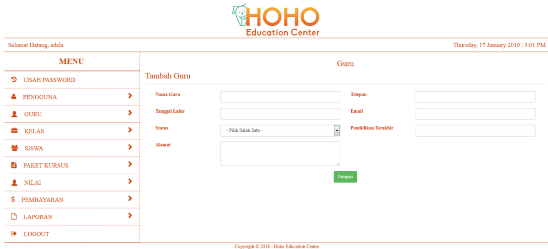
Gambar 5.15 Halaman Tambah Guru