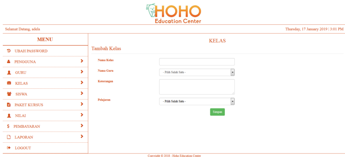
Gambar 5.16 Halaman Tambah Kelas

Halaman tambah kelas merupakan halaman yang dapat diakses oleh pengguna sistem untuk menambah data kelas baru kedalam database . Gambar 5.16 merupakan hasil implementasi dari rancangan pada gambar 4.42.